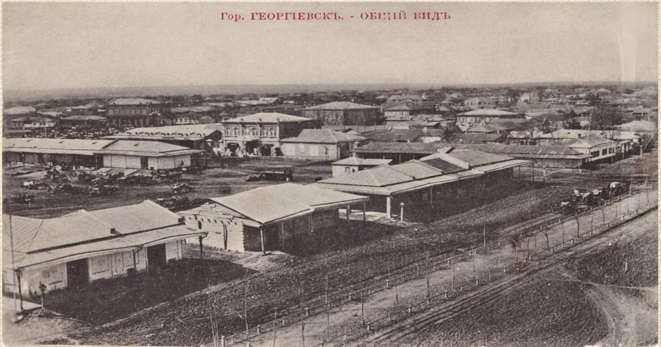
Гор. ГЕОРГИЕВСКЪ. - ОБЩИЙ ВИДЪ

"Старый город" - это "изюминка" сегодняшнего Георгиевска, его легенды и были, тени прошлого и день нынешний. Улицы города, дома - это тоже история.