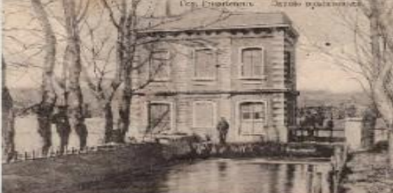
Уч. Горьковский. Здание гимназии.