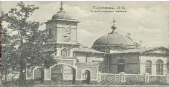
Горьковский М. С. Католическая церковь.