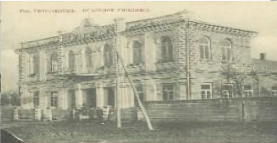
Рос. Императорск. Высшее училище.