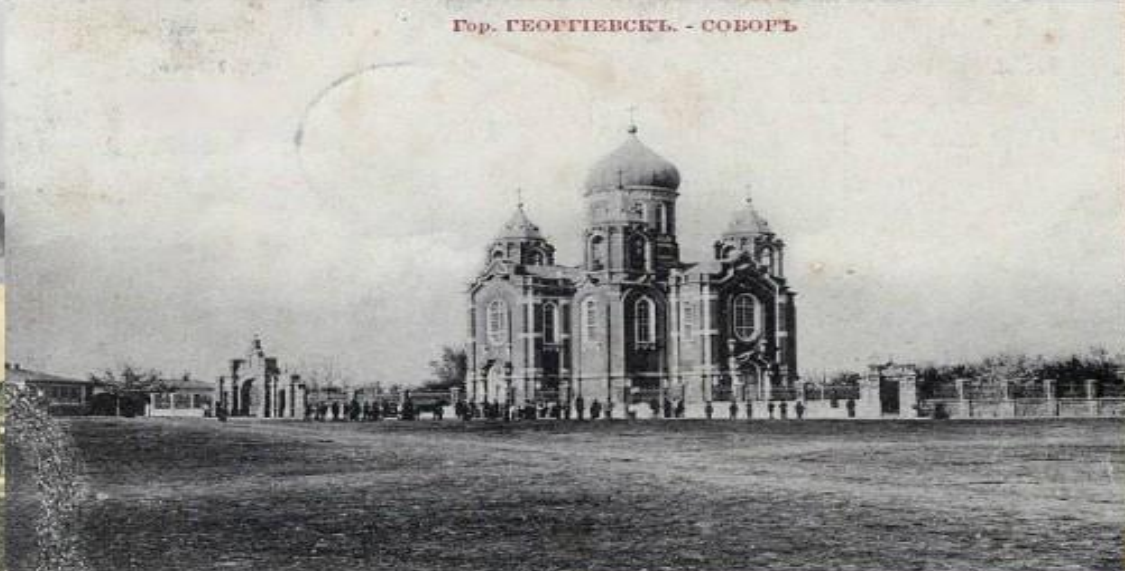
Гор. ГЕОРГИЕВСКИЙ. - СОБОРЪ