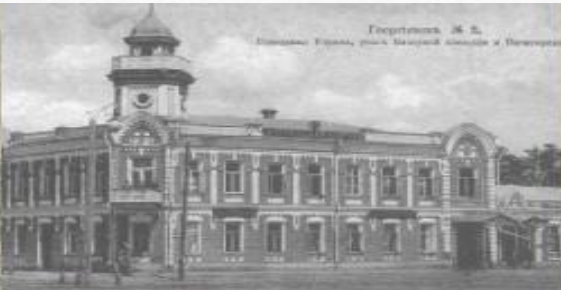
Горьковский М. С. Здание Училища, ныне Горький институт и Университет.