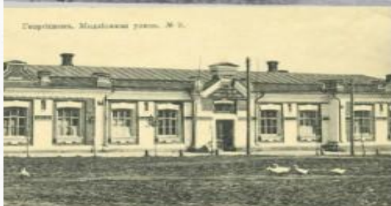
Горьковский. Младшая улица. М. С.