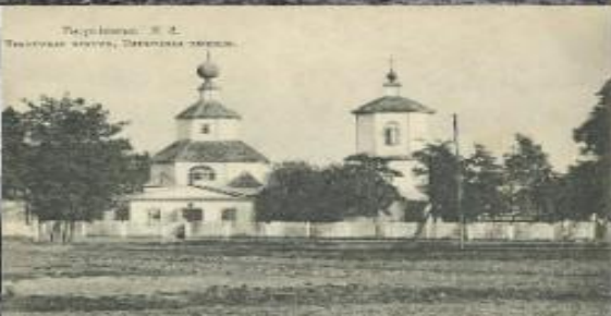
Горьковский М. С. Православная церковь, Горьковский собор.