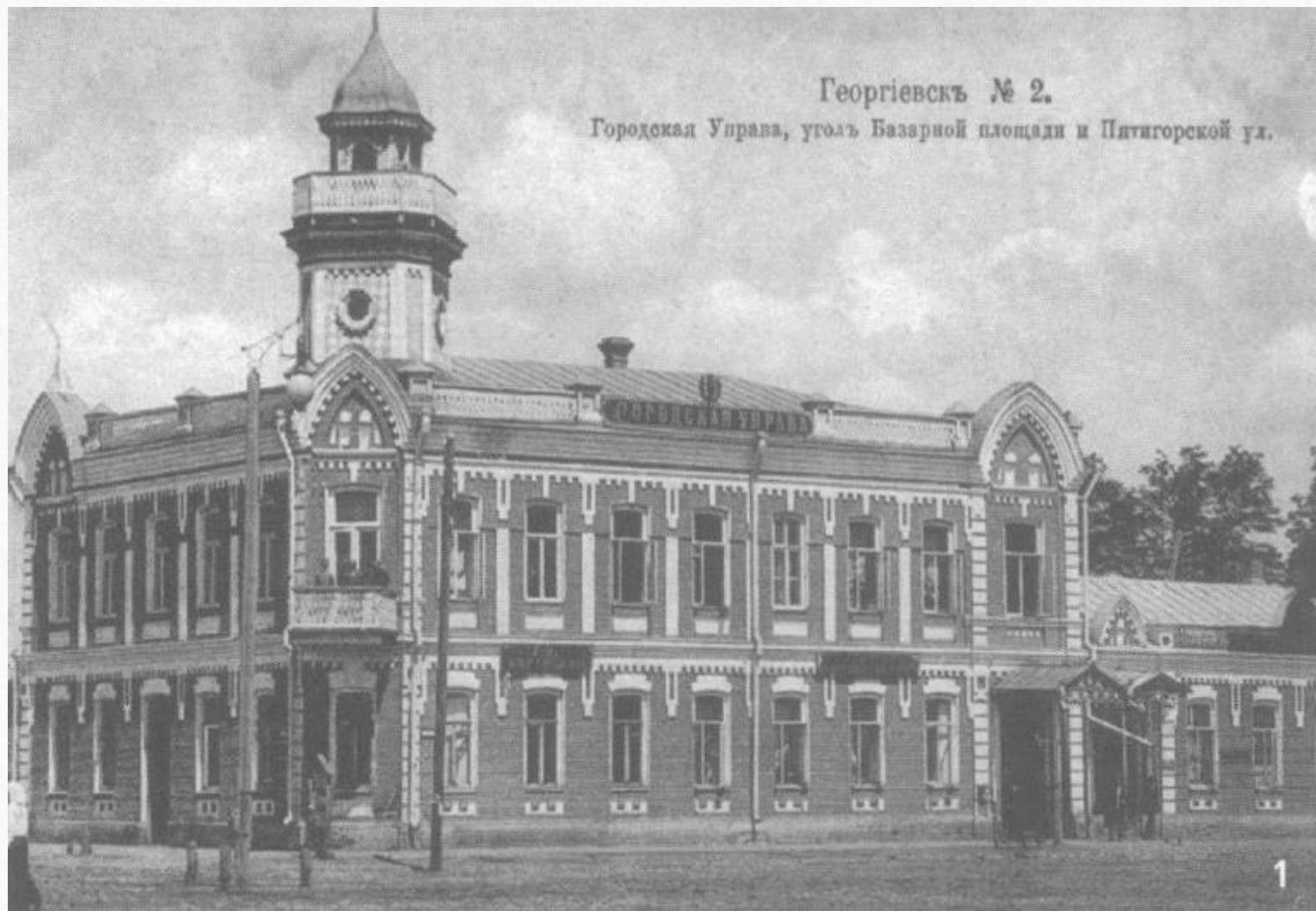
Георгиевскъ № 2. Городская Управа, уголъ Базарной площади и Пятигорской ул.

А здание городской управы сейчас занимает Сбербанк