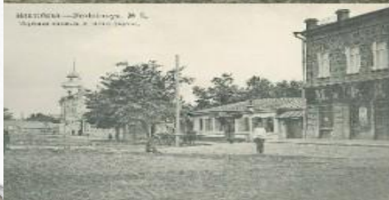
МЕСТНОСТЬ — Горьковский М. С. Церковь св. Николая Чудотворца.