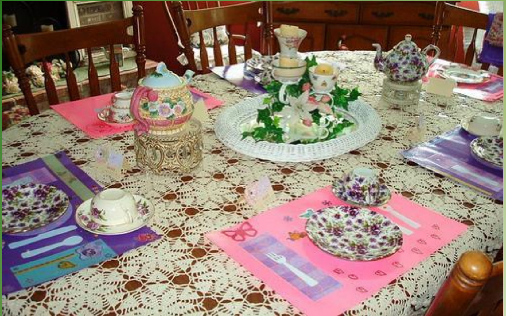
Вариант чайного стола