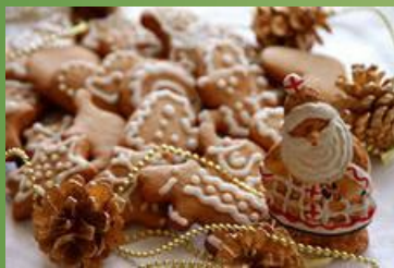
Рисунок вырезали в зеркальном изображении, «читая» форму по зеркальцу. На пряниках изображали целые города с церквями и башнями, фантастических птиц и зверей. Были даже пряники – буквари с алфавитом. На поверхности отпечатывались пожелания, затейливые надписи: «Хочешь чаю хлебнуть, про меня не забудь», «Родом я из Тулы, самовару брат».

В Туле издавна делали печатные пряники. Печатными пряники называли так потому, что их на самом деле печатали, как книги. Для этого изготавливали специальную пряничную доску из твердой древесины лиственных пород (клён, липа, груша, берёза), возраст которых 25-30 лет, а затем на ней вырезали рисунок.