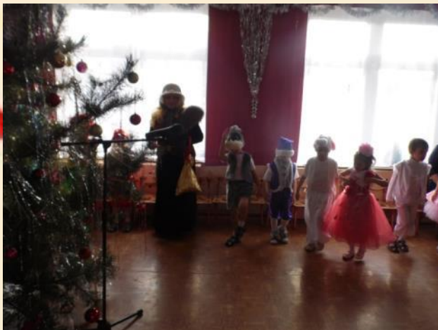
Мы встречаем Новый год