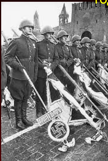
Солдаты несут вражеские Знамена к подножию Мавзолея