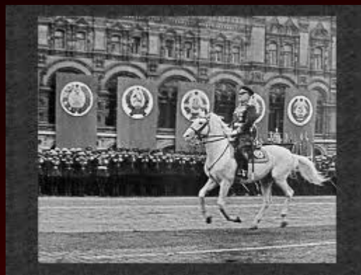
Маршал Жуков принимает парад Победы