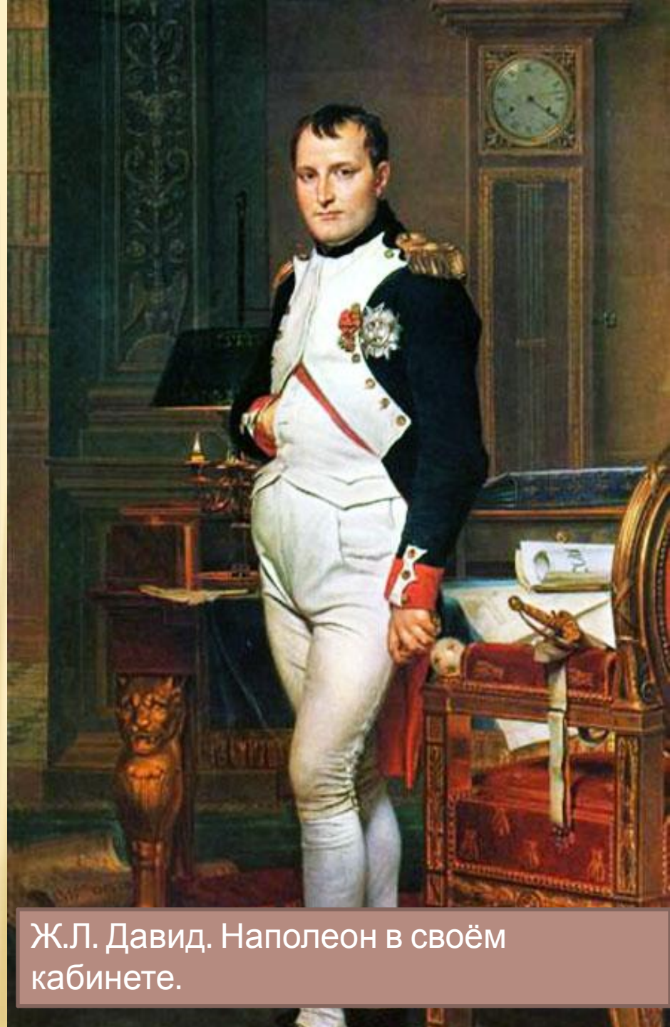
Ж.Л. Давид. Наполеон в своём кабинете.

12 июня 1812 года громадная французская армия вторглась в Россию. Началась Отечественная война русского народа против захватчиков.