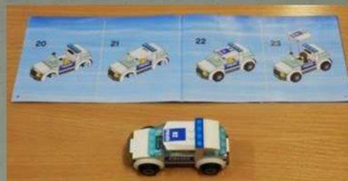
Конструирование по схеме