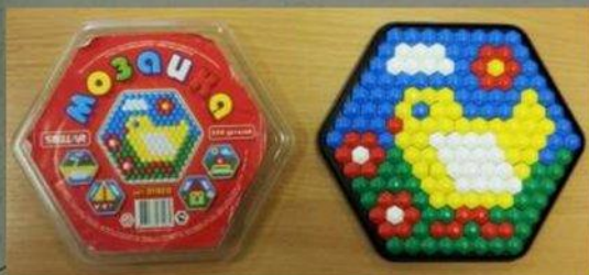
Выкладывание узоров из мозаики