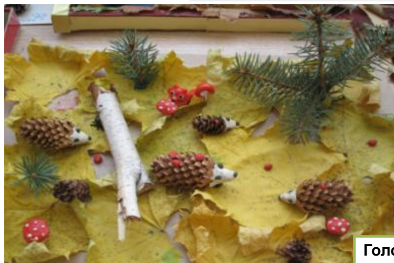
Голосов Дима «Ежики на прогулке»