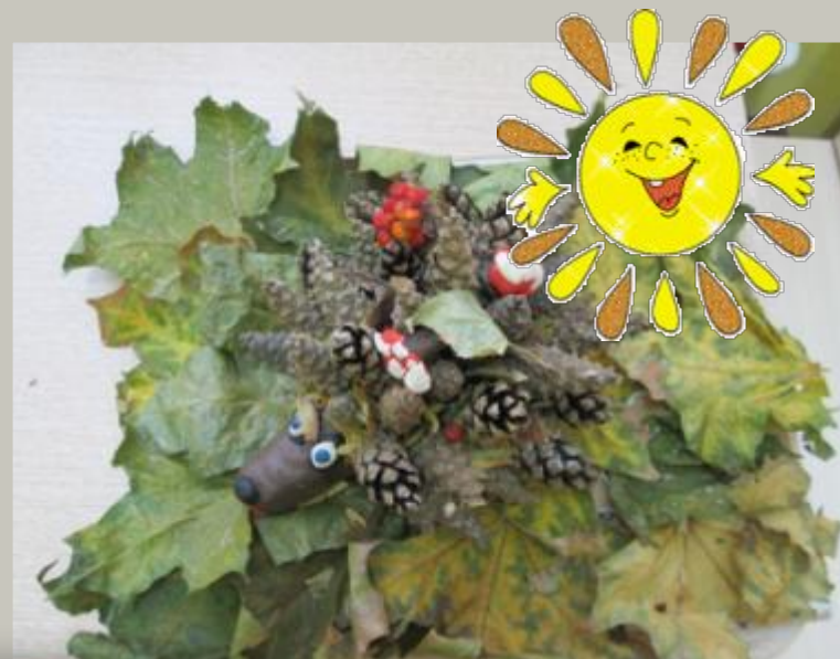
Автаев Дима «Запасливый ежик»