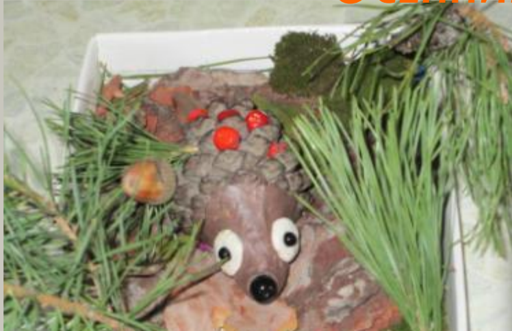
Газизова Вероника «Ежик с яблоками»