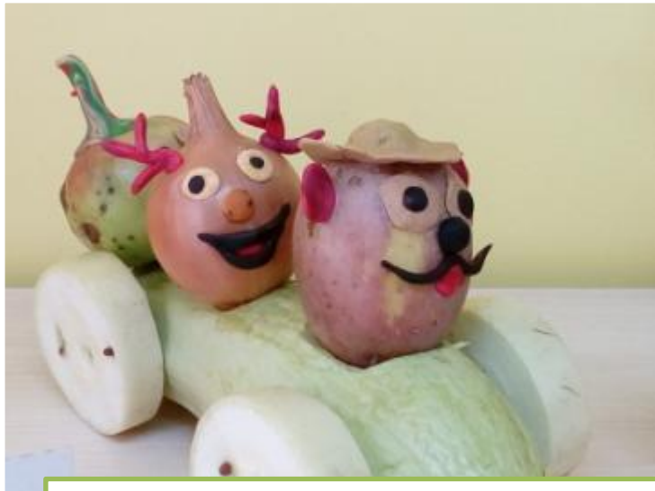
Навметов Миша «Веселая компания»