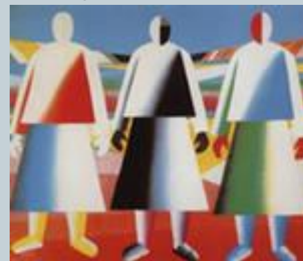
К.С. Малевич «Девушки в полях»