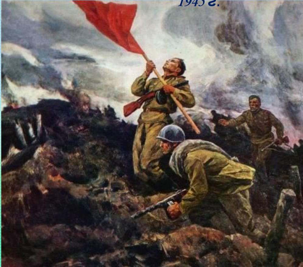
А. Широков. За Родину!