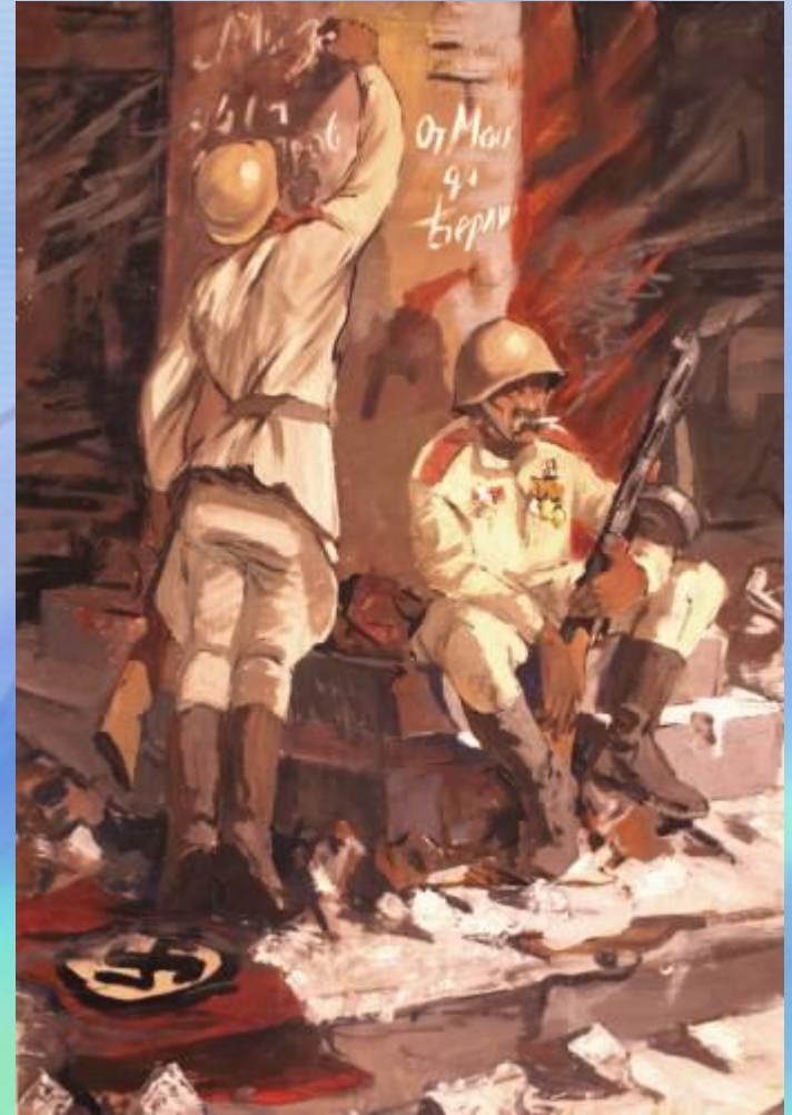
художник Володин С.А.