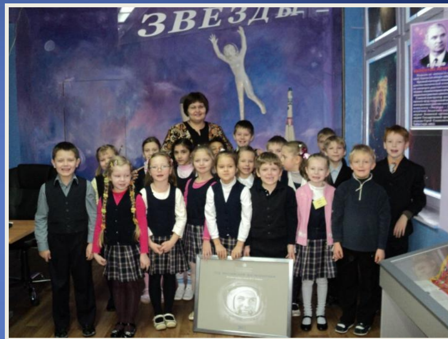
В школьном музее КОСМОНАВТИКИ