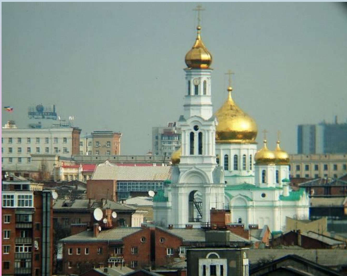
Кафедральный собор рождества Пресвятой Богородицы