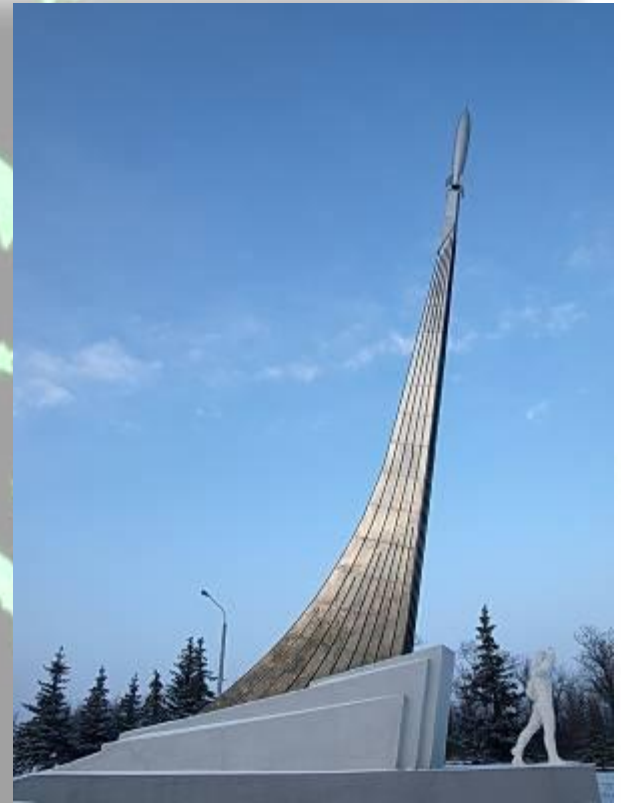
Памятник Ю. Гагарину на месте приземления возле города Энгельс в Саратовской области