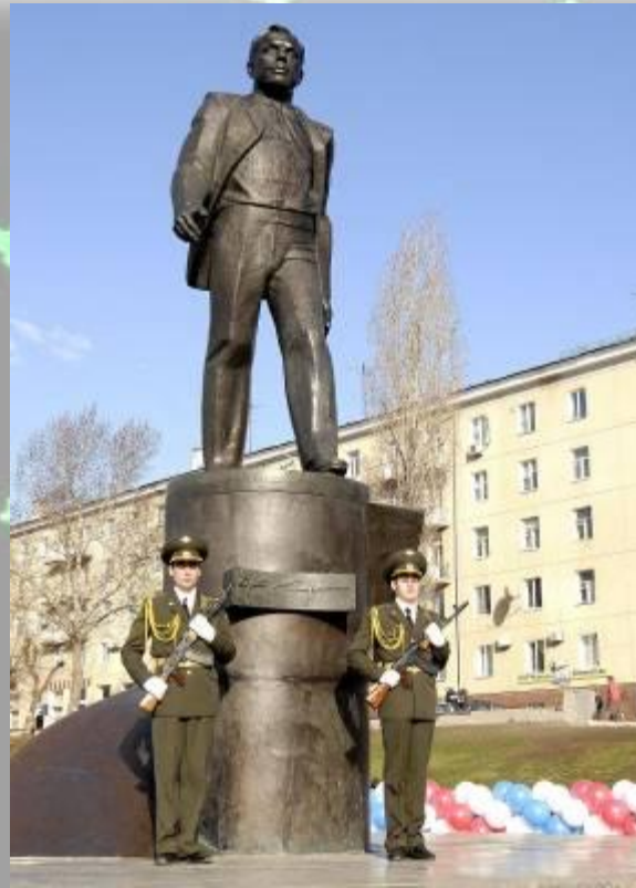
Памятник , Гагарину в Саратове на Набережной Космонавтов