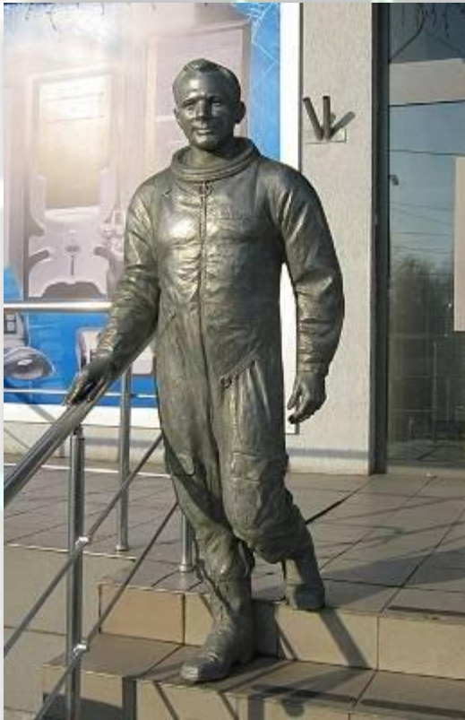
Памятник Ю. Гагарину в Харькове