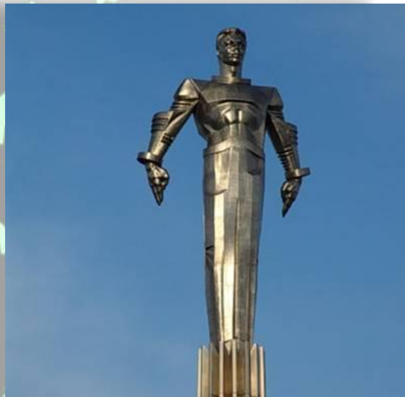
Памятник Ю. Гагарину в Москве

Во многих городах России и других стран существуют улицы, проспекты, площади, бульвары, парки, клубы и школы имени Гагарина.