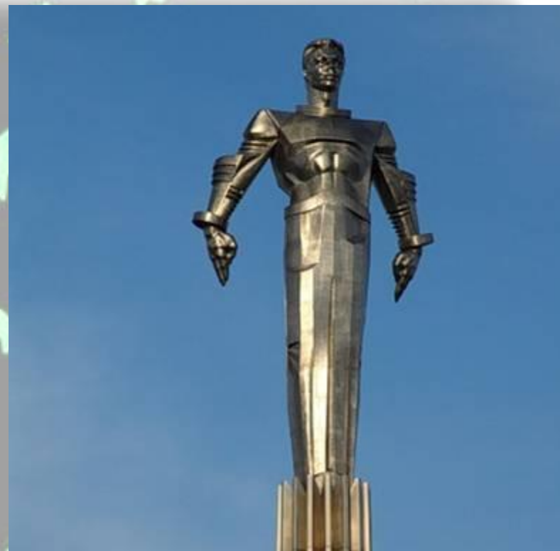
Парк им. Ю. Гагарина в Самаре