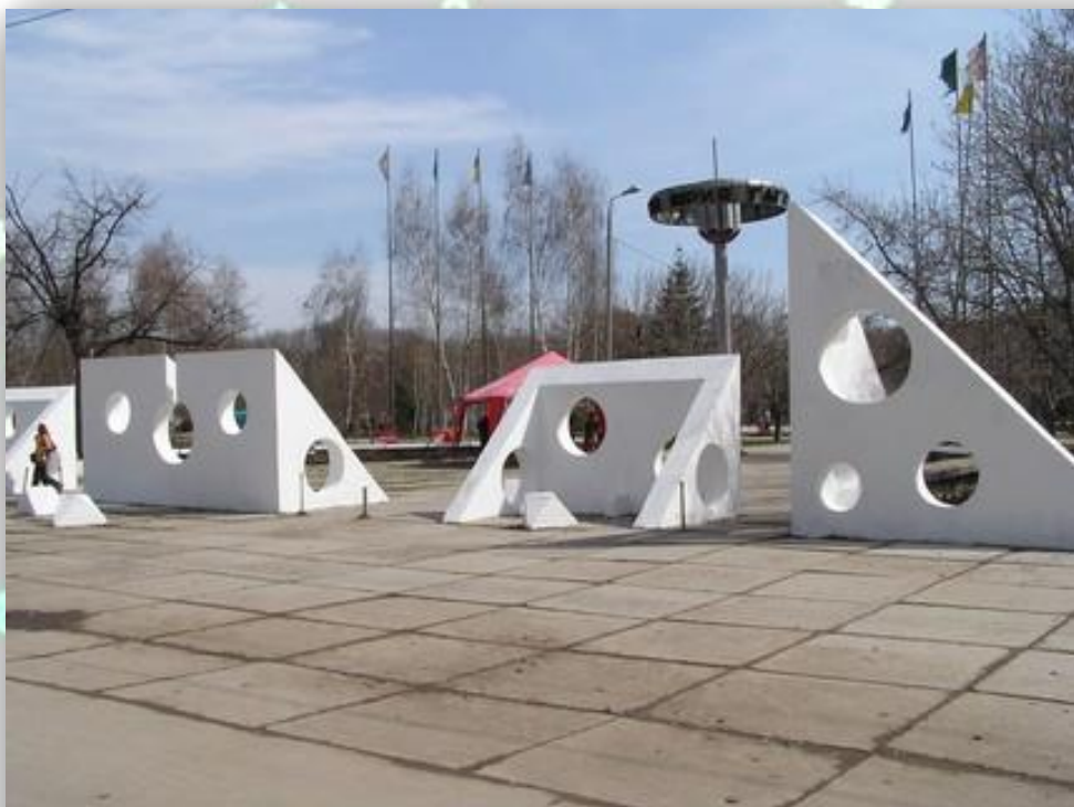
Парк им. Ю. Гагарина в Самаре