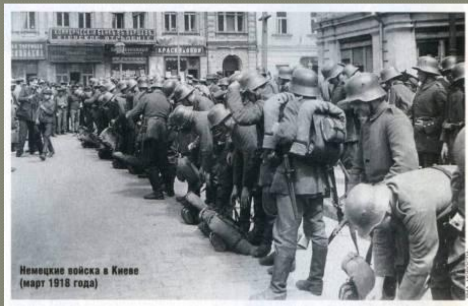
Немецкие войска в Киеве (март 1918 года)