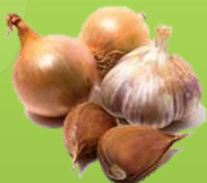
Лук и чеснок

Растения, содержащие аллицин, который блокирует особые ферменты, способствующие распространению вирусов в организме.