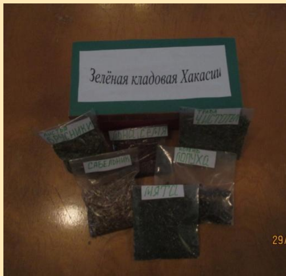
«Шкатулка с лечебными травами»