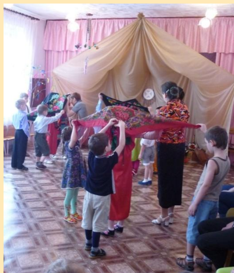
Развлечение «Щилых- хакасские посиделки»