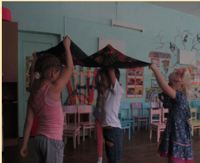
Игра «Построй юрту»