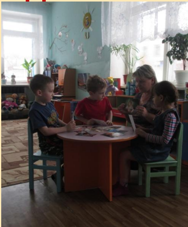
Беседа на тему «Моя родословная»

«Генеалогическое древо» хакасских семей подготовительной группы