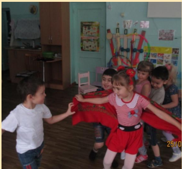
Игра «Коршун и наседка»