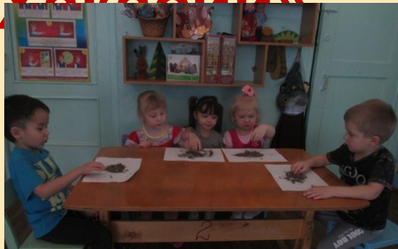
Исследовательская деятельность «Душистая трава»