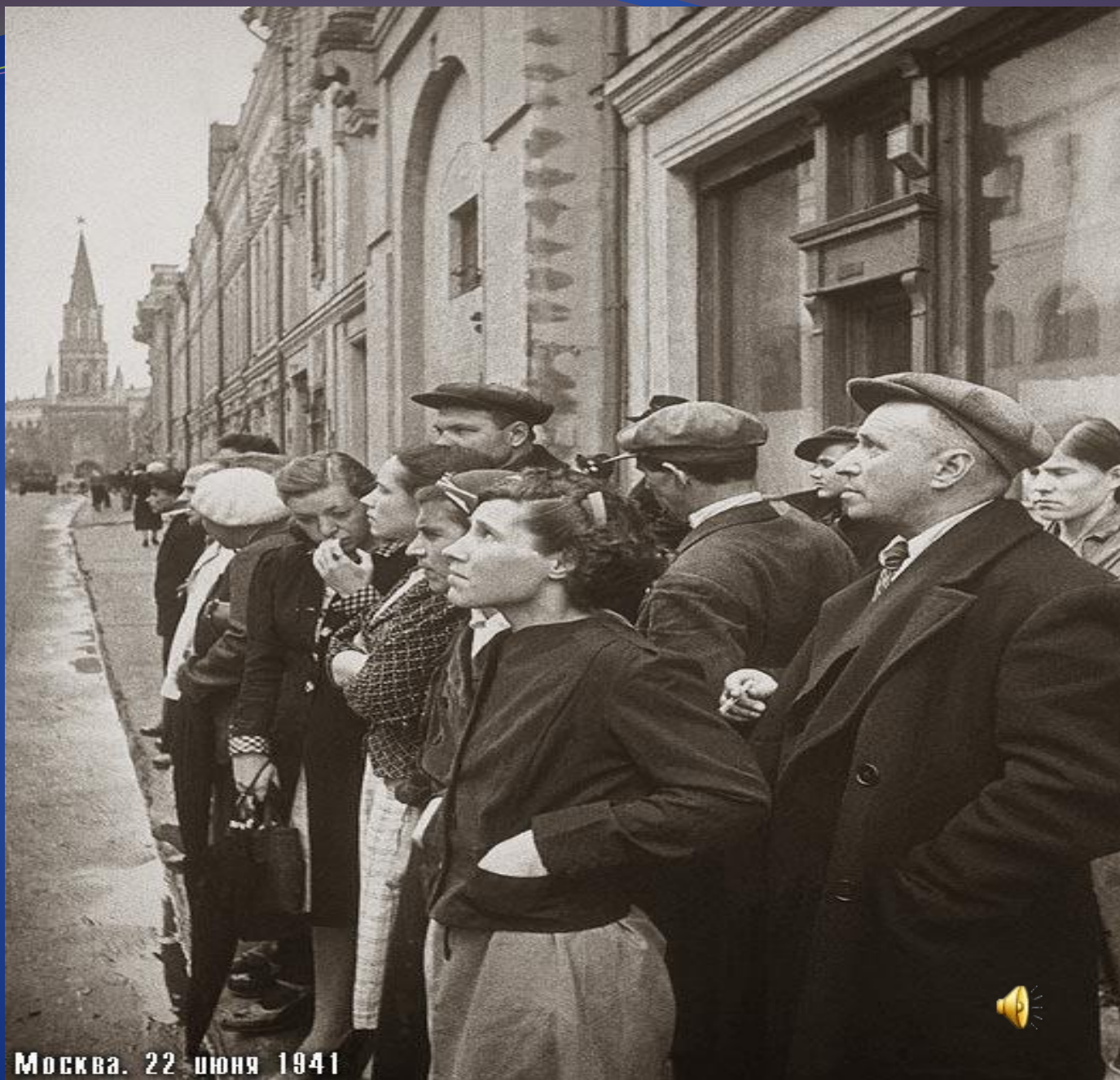
Москва. 22 июня 1941