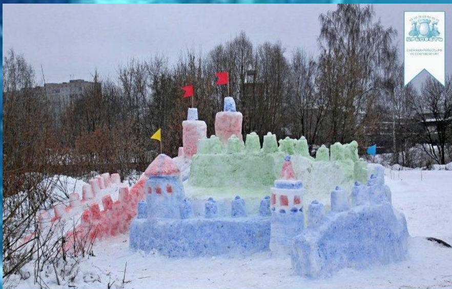
“Белоснежка и семь гномов”

Я как будто бы герой, Крепость снежную свою Защищаю в злом бою! Все удары отражаю, Всех снежками закидаю!