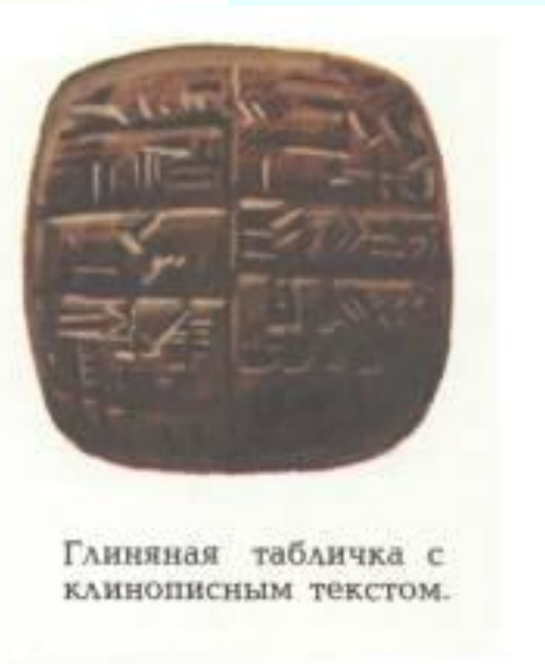
Глиняная табличка с клинописным текстом.