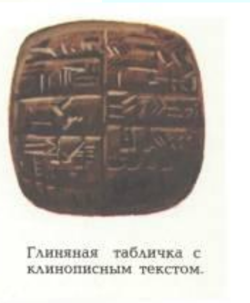
Глиняная табличка с клинописным текстом.