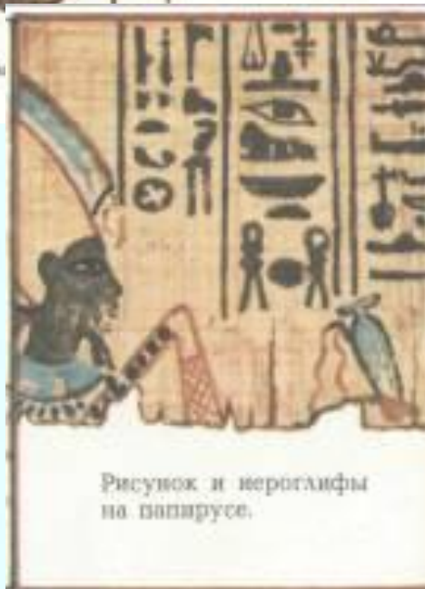
Рисунок и иероглифы на папирусе.