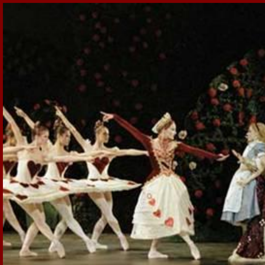
Алиса в Стране Чудес

Много замечательных опер и балетов поставлено по сказкам.