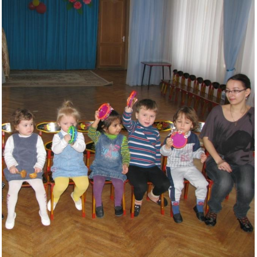
На дне рождения у куклы Маши звучит оркестр.