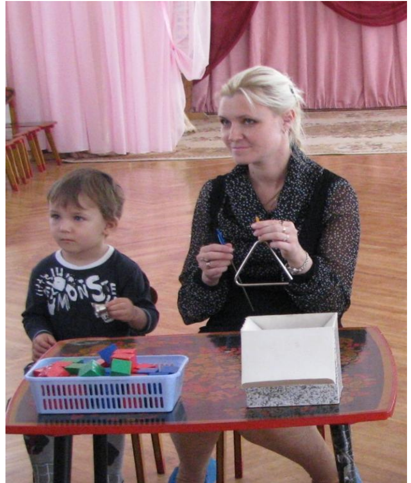
Мама с сыном сочинят нам музыку дождя.