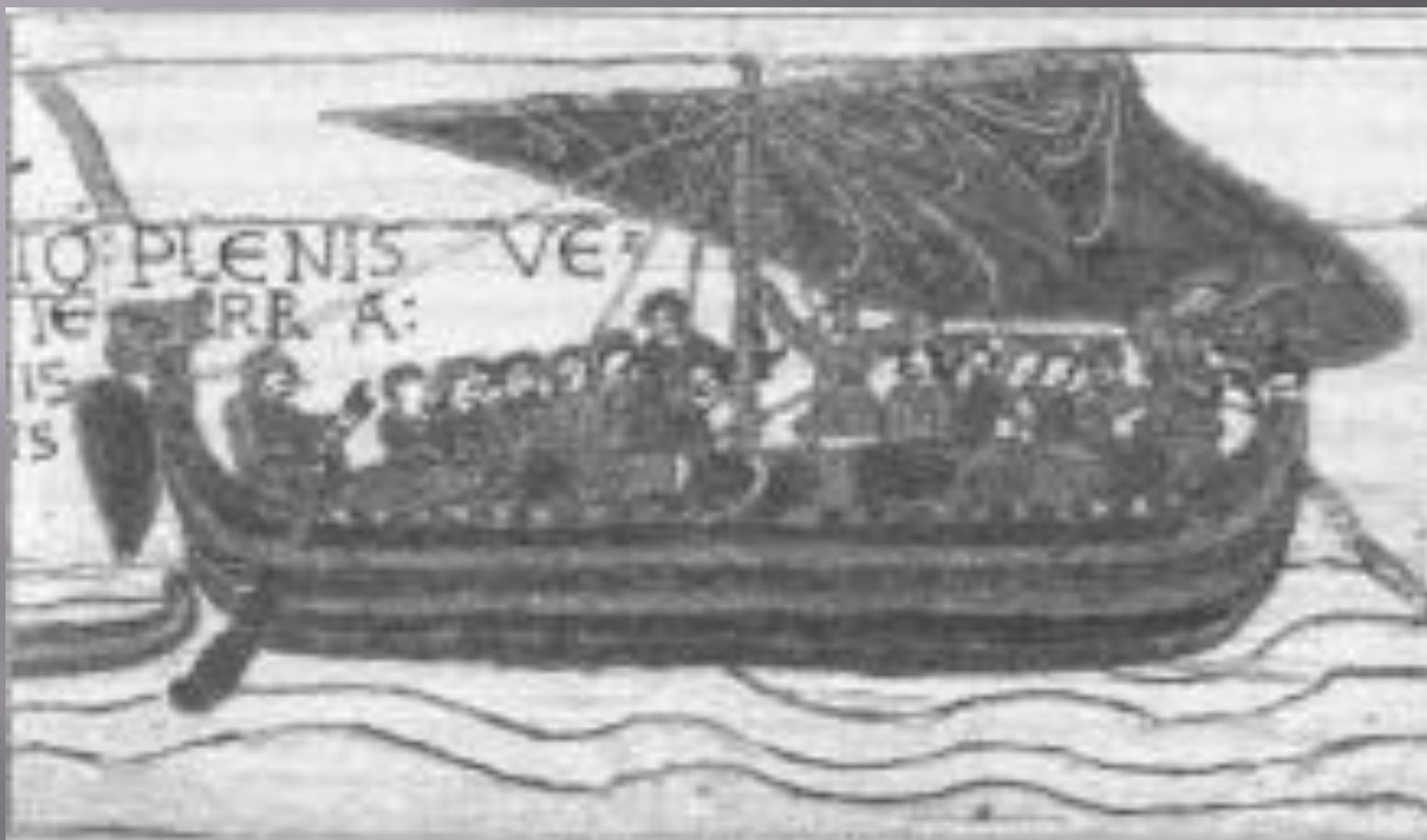
Викинги на ладье

Передняя и задняя части судна закрывались небольшими палубами. На носу находился вперёдсмотрящий, или вестовой, а на корме — кормчий. Средняя часть предназначалась для викингов и во время стоянок накрывалась своеобразным навесом из толстого сукна или того же паруса для защиты людей от непогоды и ветра. Его натягивали на уложенную горизонтально в Т-образные подставки мачту, играющую в этом случае роль конька.