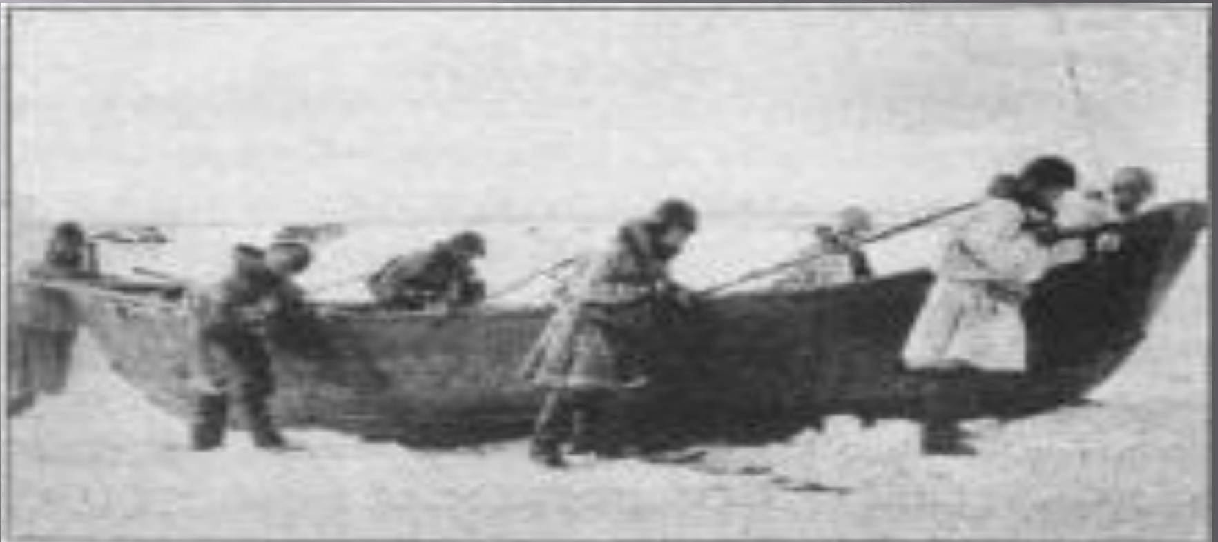
Оставшийся промысел подморем

Если выйти на самое знаменитое место набережной реки — мыс Пур-Наволок, то слева можно увидеть Красную пристань, откуда испокон веку отправлялись корабли в полярные плавания: на рыбный промысел — на Мурман, звериный — на Матку (Новая Земля) и Грумант (Шпицберген), в Норвегию и дальше, добираясь до стран Западной Европы. Отсюда в поисках Северного полюса в самом начале прошлого века уходила шхуна «Святой Фока» с капитаном Георгием Седовым на борту, чтобы остаться потом навсегда в полярных льдах. Справа от Пур-Наволока видны Мосеев остров и знаменитая Соломбала — на берегах которой, на месте древних плотбищ, Петром I была построена первая российская судостроительная верфь.