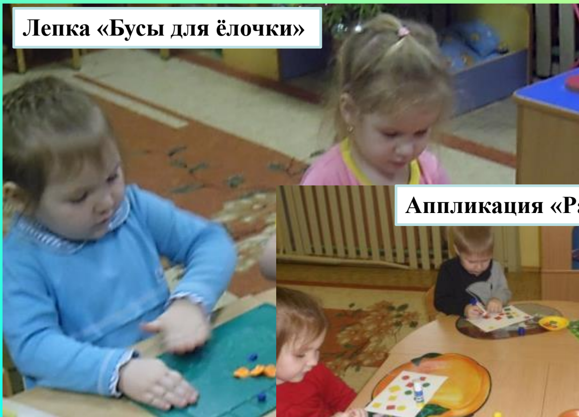
Аппликация «Разноцветный ковёр»