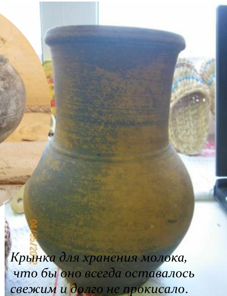
Крынка для хранения молока, что бы оно всегда оставалось свежим и долго не прокисало.