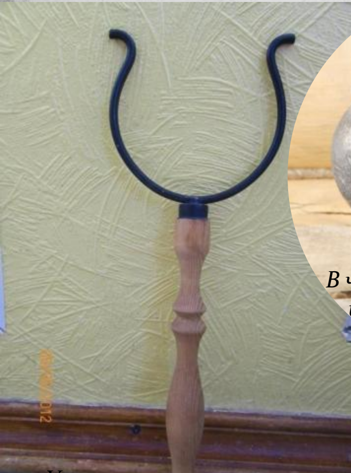
Ухват, им отправляли в жар горшки с пищей.