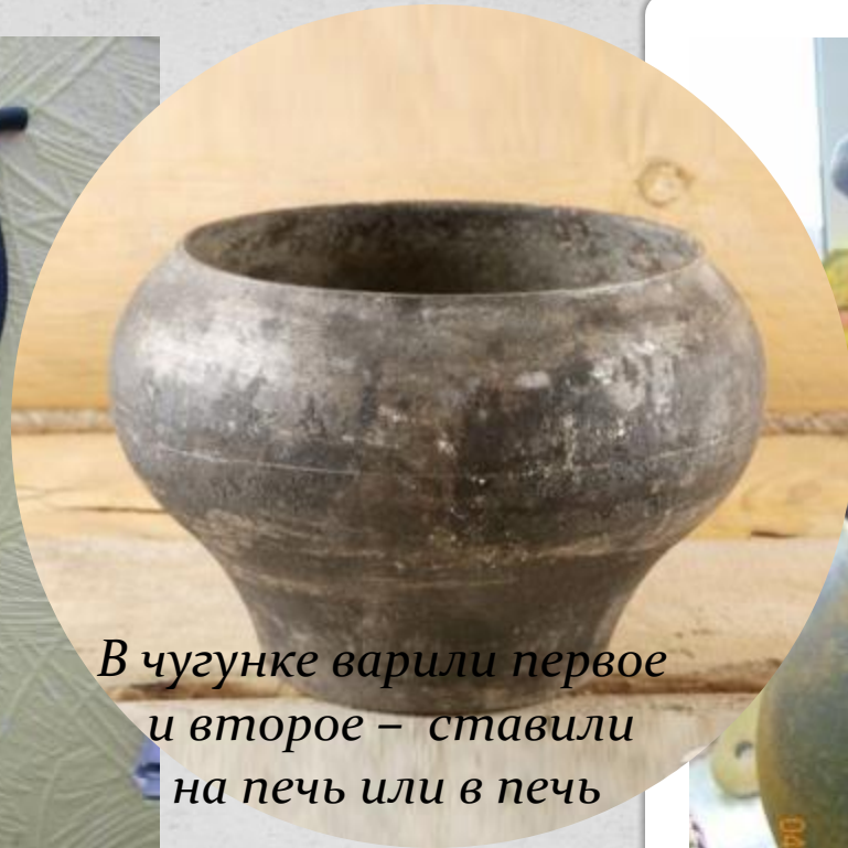
В чугушке варили первое и второе – ставили на печь или в печь