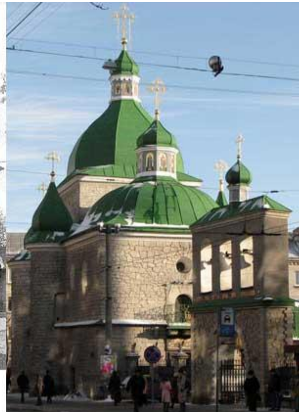
Церква Різдва Христового: архівне і сучасне фото