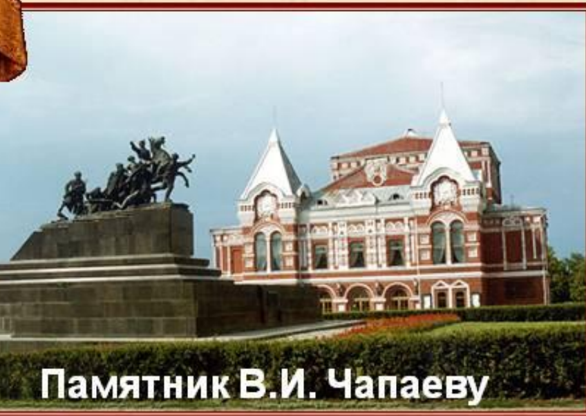
Памятник В.И. Чапаеву