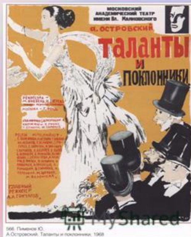
566. Паминко Ю. А.Островский. Таланты и поклонники, 1928