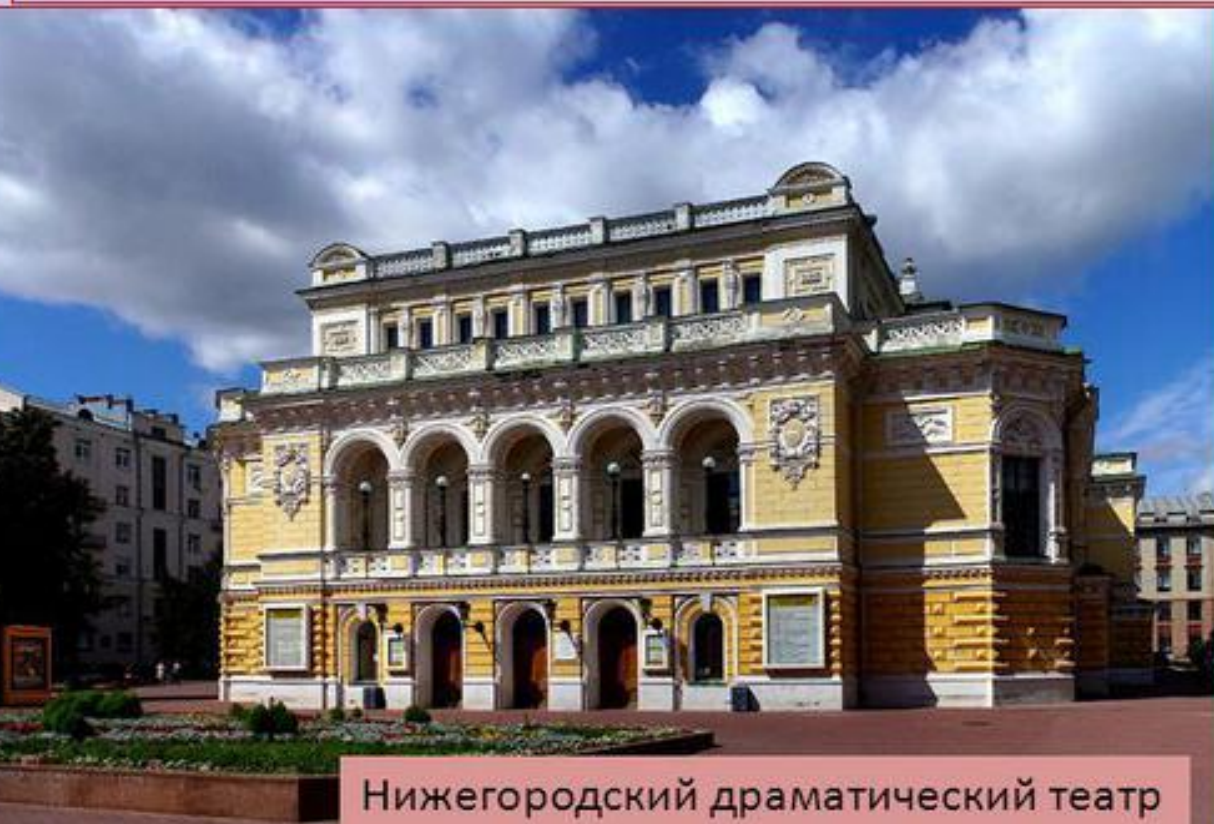
Нижегородский драматический театр

К драматической литературе относятся драма, комедия, трагедия, трагикомедия, мистерия, водевиль, фарс, мелодрама.