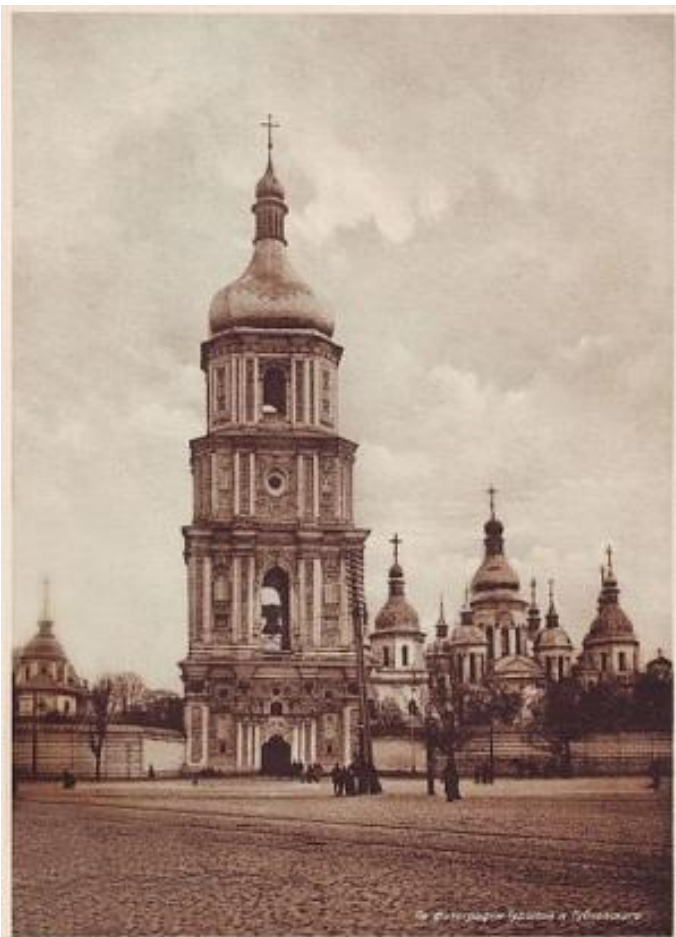
Софійський кафедральний собор.