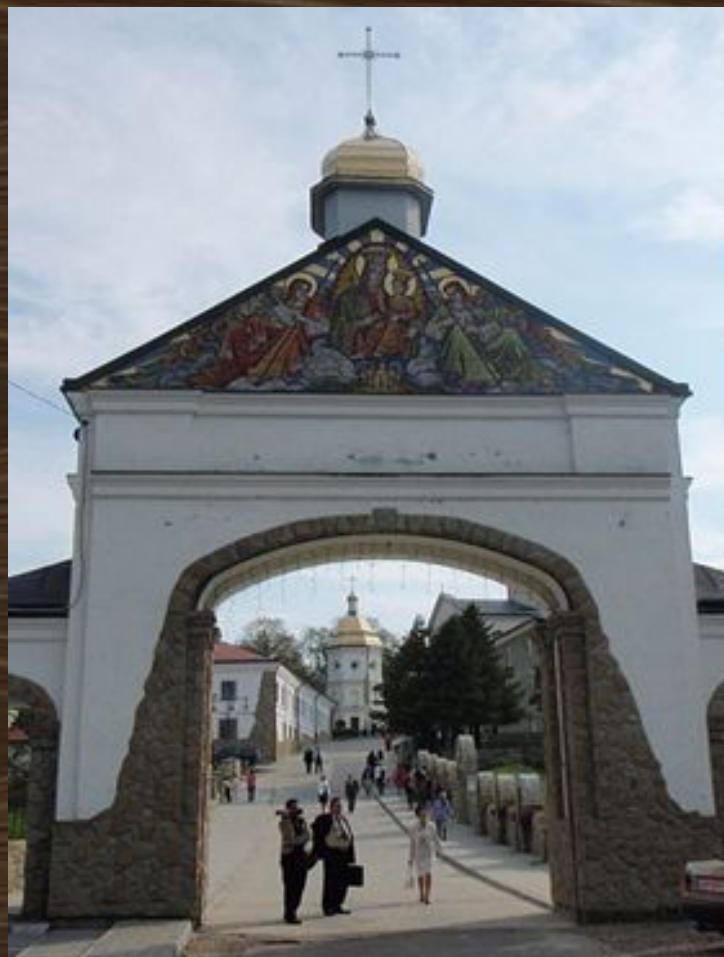
Гошівський монастир отців Василіян і церква Преображення