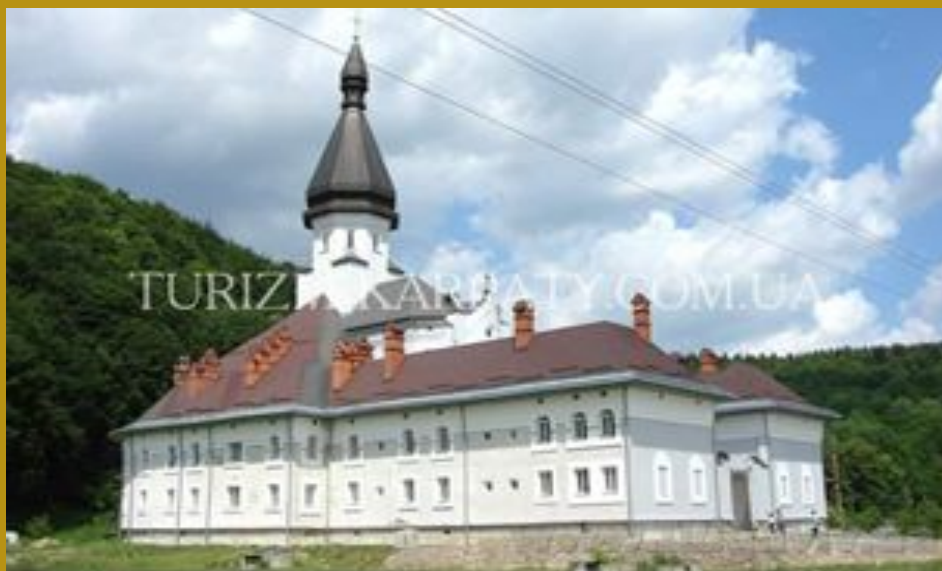
Монастир сестер Пресвятої Родини