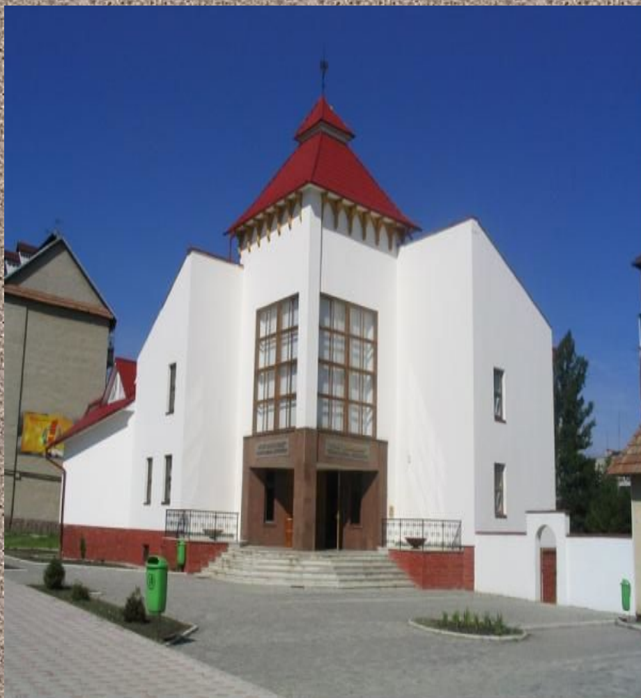
Долинський краєзнавчий музей Тетяни і Омеляна Антоновичів «Бойківщина»