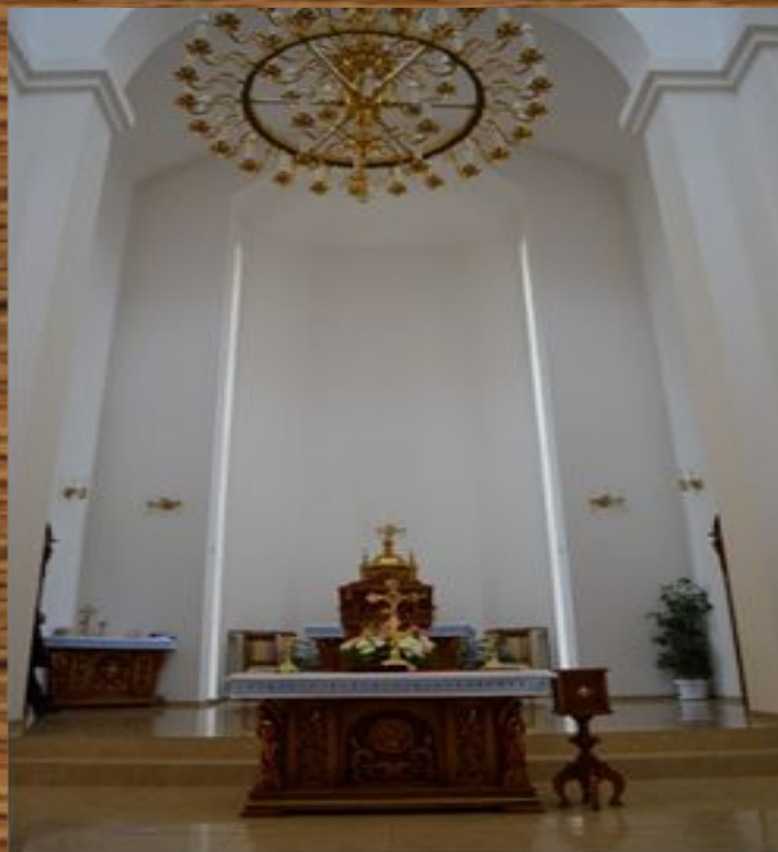
Церква Різдва Пресвятої Богородиці