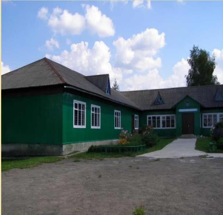
Музей історії села Новошин