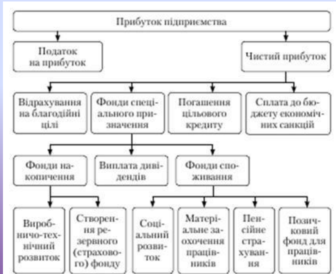
Схема розподілу прибутку підприємства