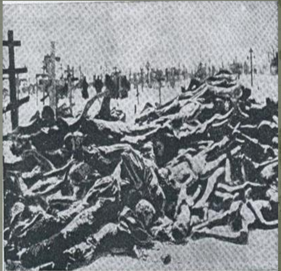
Кладовище в Харкові. Замерзлі трупи українських селян померлих з голоду. 1933 р.

Радянські архівні матеріали, що стосуються сталінської доби, залишаються в основному недоступними. Тому важко остаточно визначити кількість померлих з голоду. За підрахунками, що спираються на методи демографічної екстраполяції, число його жертв в Україні коливається в межах 3—6 млн чоловік. Одним із чинників, що допомагають пояснити цю ситуацію, було те, що згідно з першим п'ятирічним планом «Україна ... мала служити колосальною лабораторією випробування нових форм соціально-економічної та виробничо-технічної перебудови сільської економіки всього Радянського Союзу».