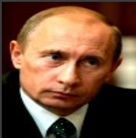
В.В.Путин Второй Президент РФ март 2000- май 2008 гг.;