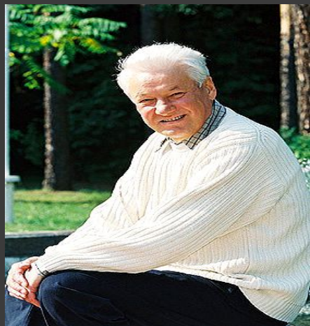
Б.Н.Ельцин Первый Президент РФ июнь 1991-декабрь 1999 гг.