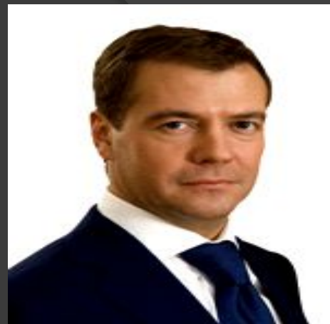
Д.А.Медведев Третий Президент РФ март 2008 – май 2012 гг.