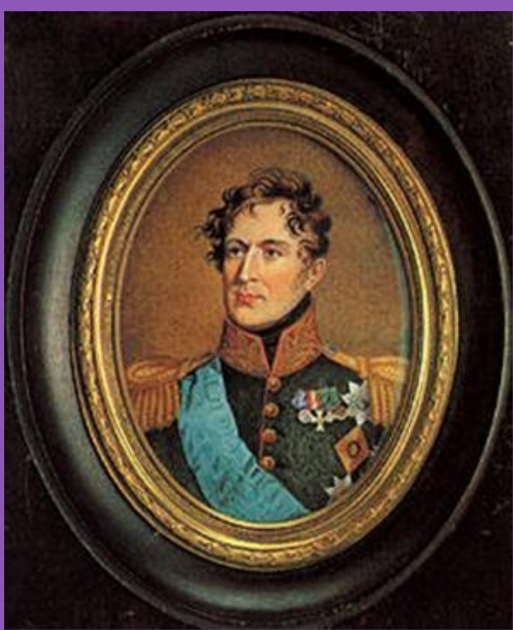
Н.Силов. Генерал Милорадович.

В середине дня Николай решил вступить с ними в переговоры, но митрополит был отогнан выстрелами, а генерал-губернатора Петербурга, героя войны 1812 г. ген.Милорадовича П. Каховский застрелил из пистолета выстрелом в спину. После этого Николай приказал войскам открыть огонь по восставшим картечью. Первые залпы пришлось в самую гущу декабристов. Офицеры попытались построить солдат на льду Невы, но новые залпы разбивали лед. Тогда было принято решение расходиться.