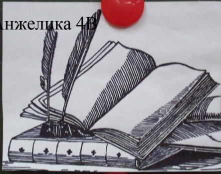
Баранова Анжелика 4В