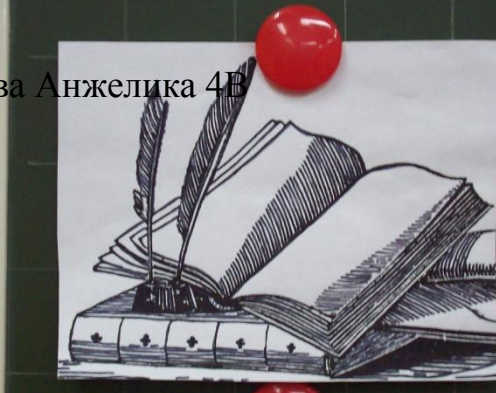
Баранова Анжелика 4В