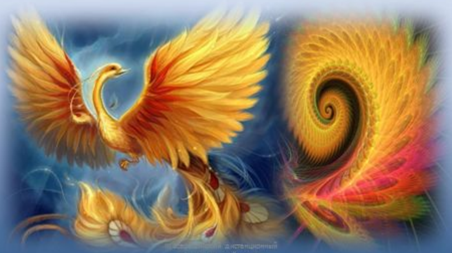
Иллюстрация: дистанционный конкурс "Детский проект"