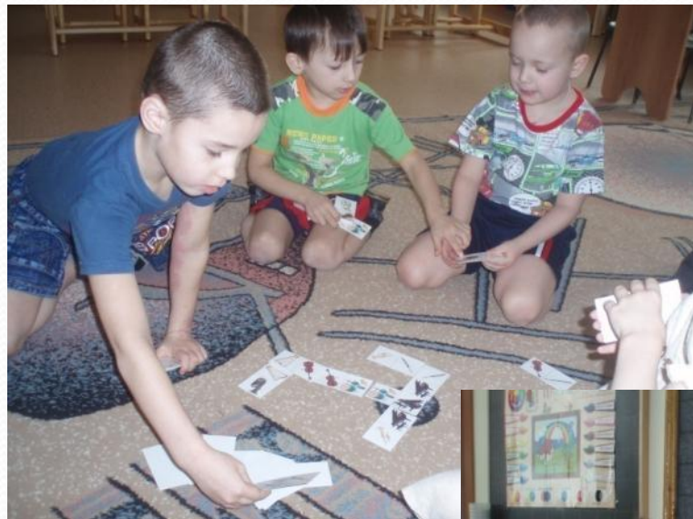
Домино «Инструменты симфонического оркестра»