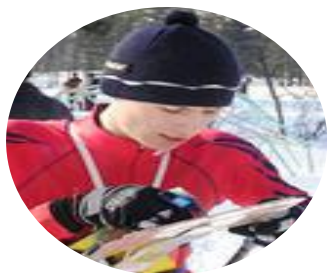
Зимнее ориентирование на лыжах