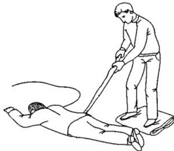
Рис. 9.15. Отодвигание провода сухой палкой от пострадавшего