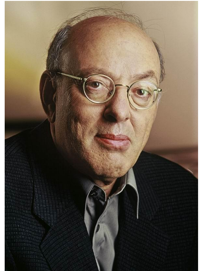
Проф. Генри Минцберг