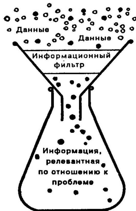
Рис. 7.2. Отбор данных