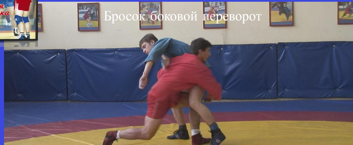
Бросок боковой переворот