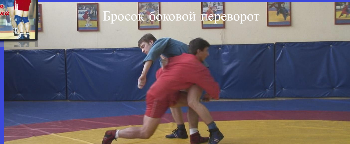
Бросок боковой переворот