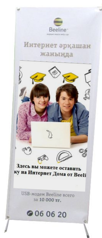
Мобильный стенд «Паук»