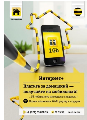
Плакат А2, А3