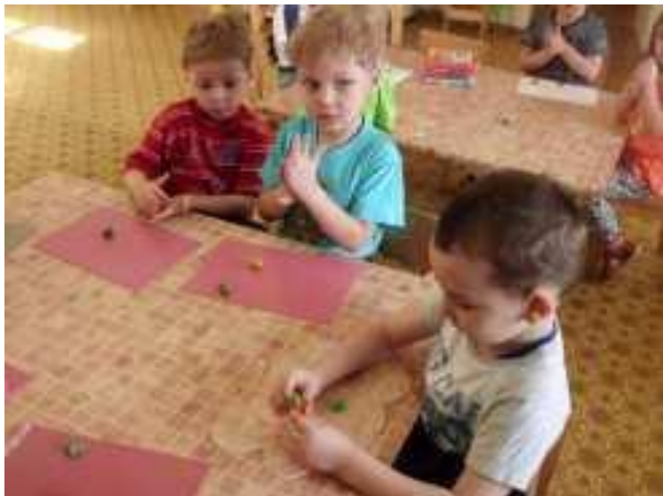
Друзья для ЧИПОЛЛИНО