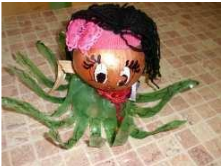
« МЕДУЗА »