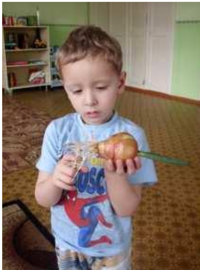
Это - корни