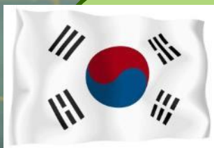
Корея - 1 чел.

Общее количество детей в ДОУ – 302 человека. 2014-2015 учебный год