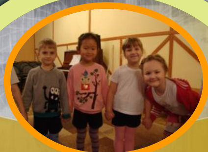
Дошкольники /возраст 5-6 лет/