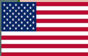
США - 2 чел.