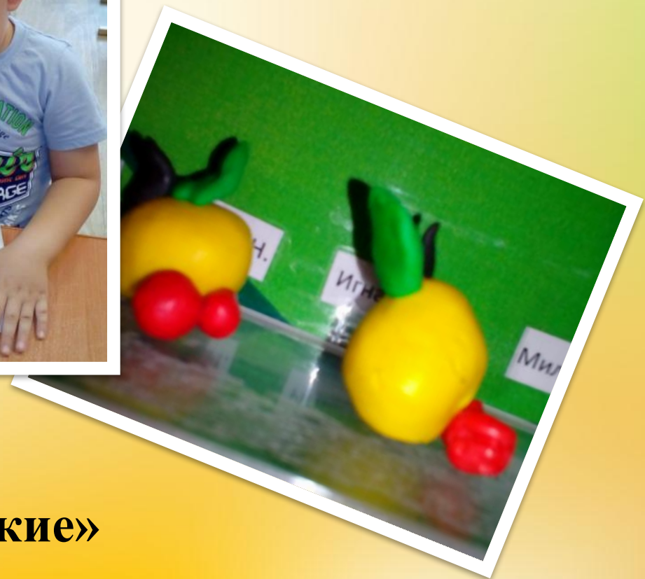
Лепка «Яблоко и ягоды»