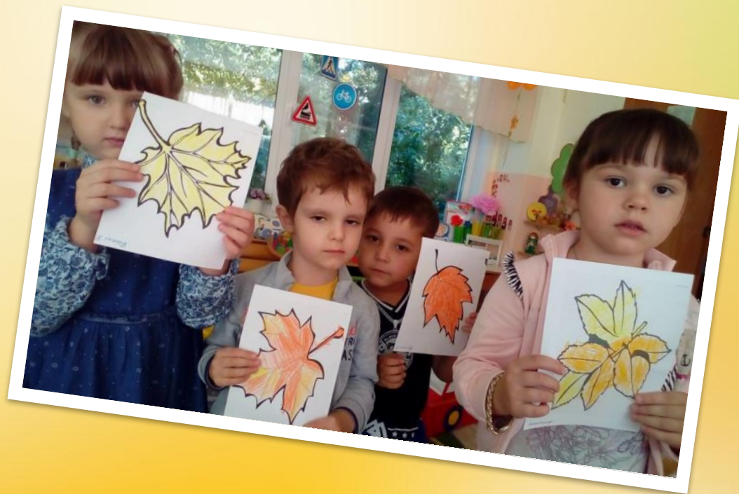
Раскрашивание «Осенние листья»