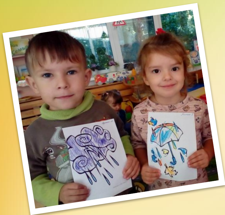
Рисование «Погода осенью»