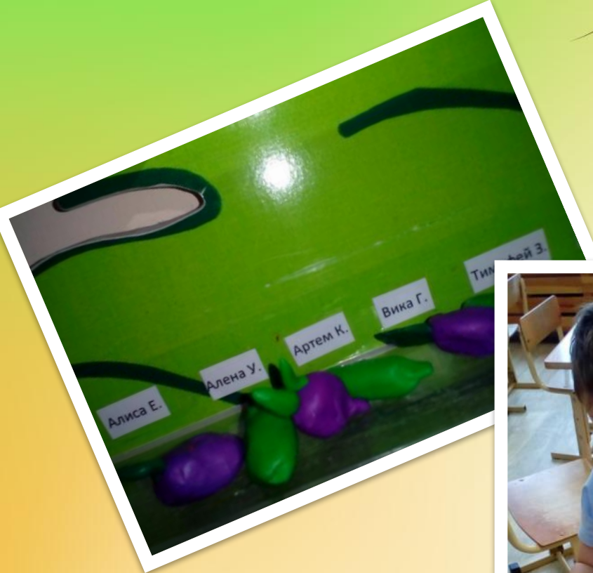
Лепка «Свекла и огурец»