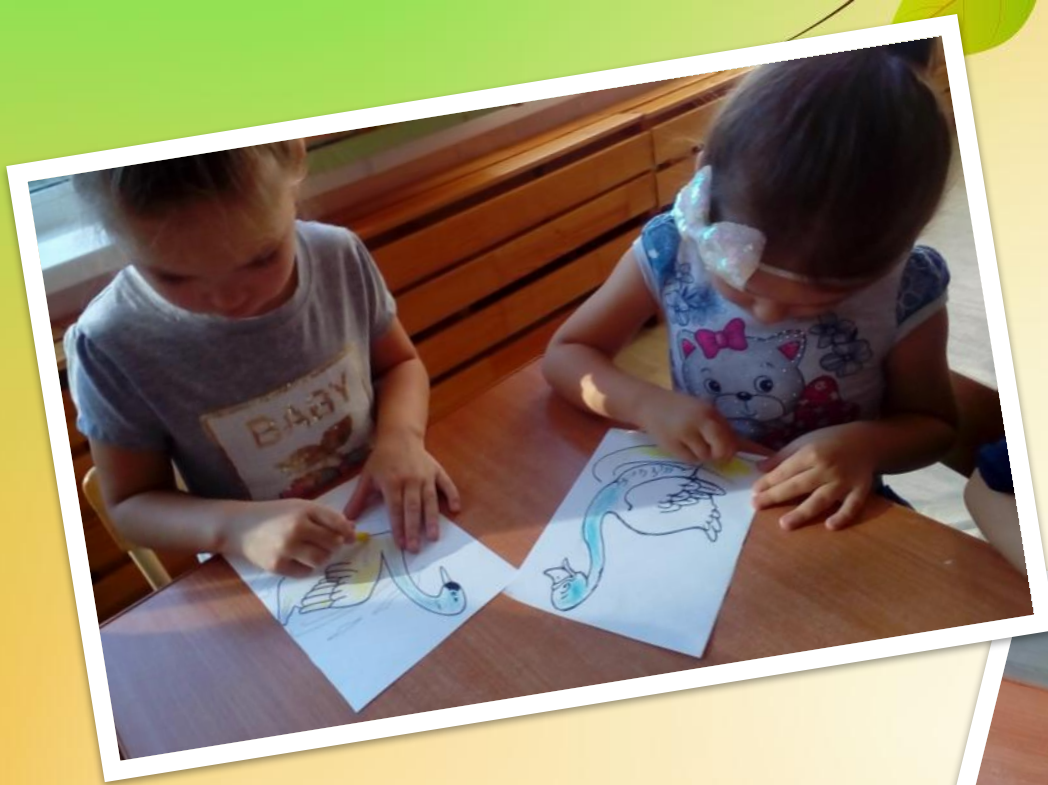
Раскрашивание «Перелетные птицы»