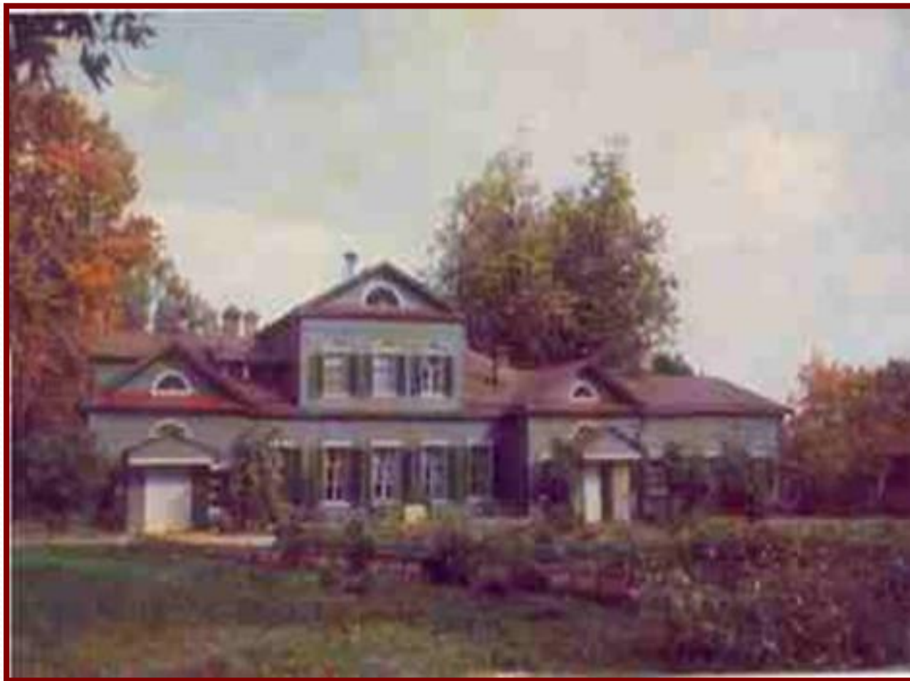
Село Абрамцевых – имение Мамонтовых