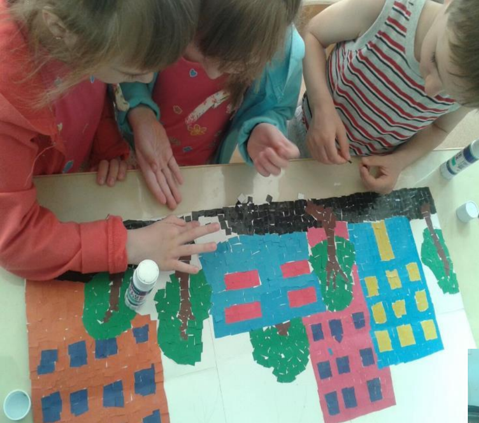
Мозаичная аппликация «Салют над мирным небом»