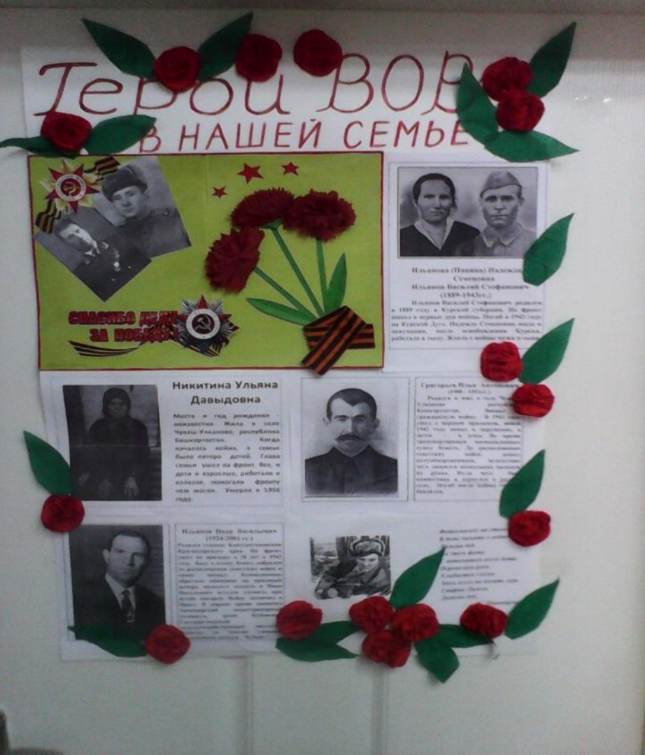
Фотовыставка «Герои ВОВ в нашей семье»