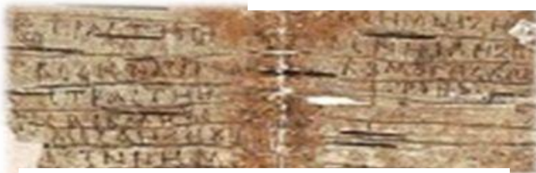
Береста в роли бумаги