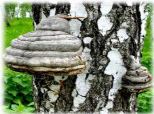
Берёзовы гриб - чага