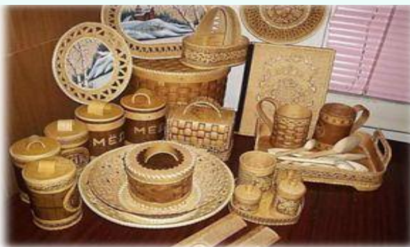
Изделия из бересты