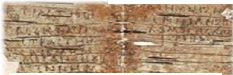
Береста в роли бумаги