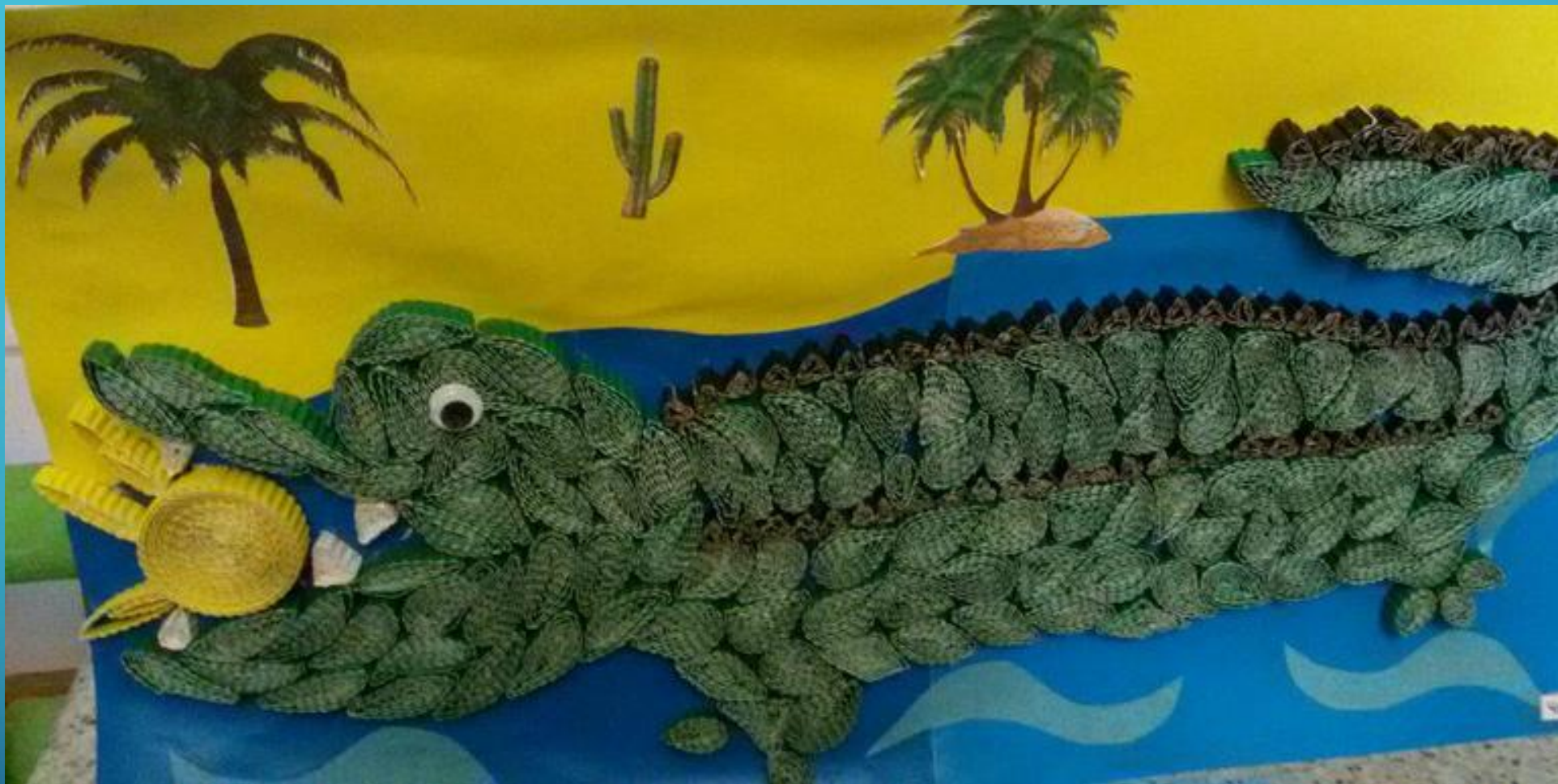
Чичиль Маша ,техника «квиллинг»