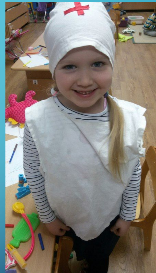
Сюжетно – ролевая игра «Доктор Айболит»