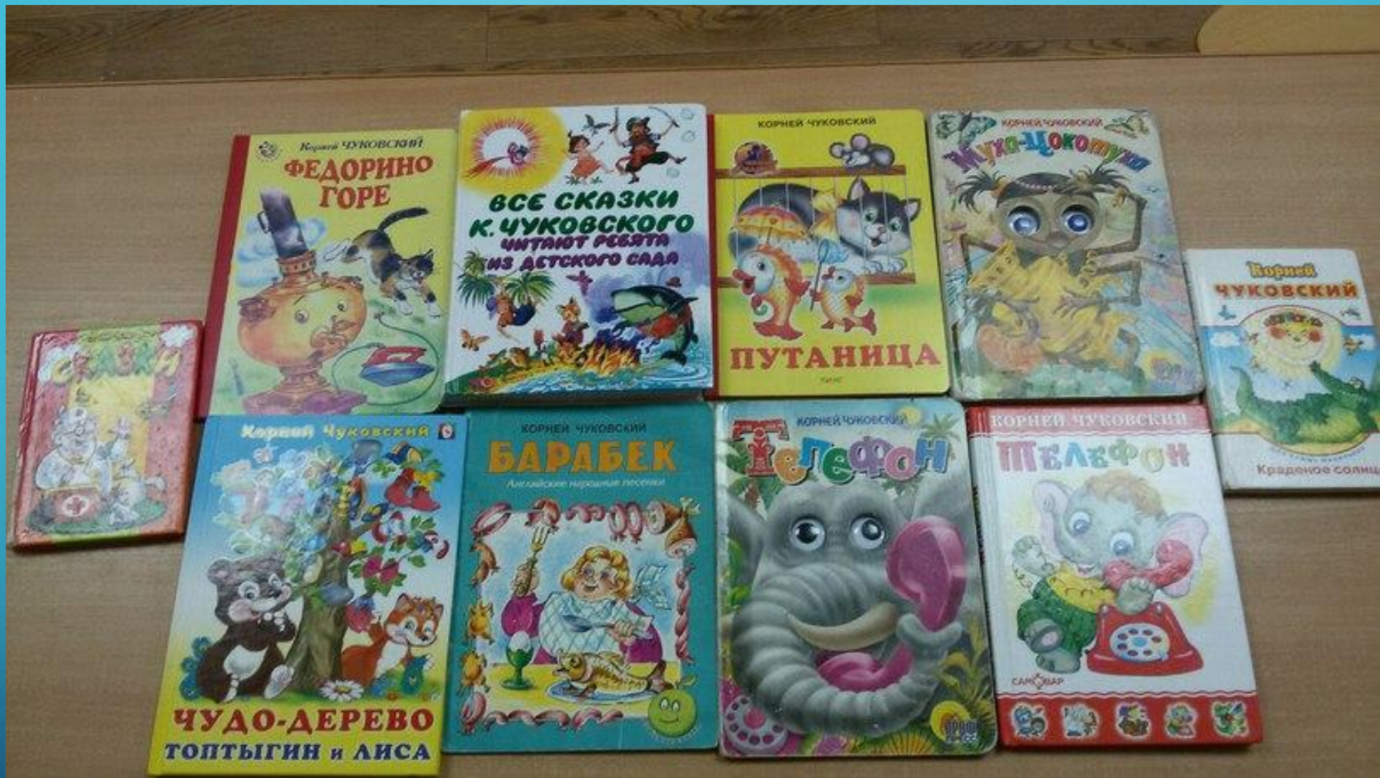
Выставка книг К.И. Чуковского в книжном уголке , иллюстрированных разными художниками