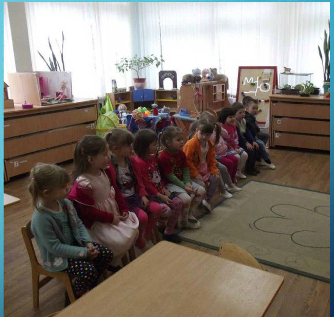
Прослушивание аудиодиска со сказками К. И. Чуковского в исполнении автора