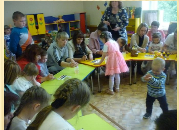
Мини-музей «Дымковское чудо»