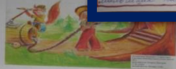
Экологическая сказка. Пожар в лесу.

В одной очень чистой речке жила- была рыбка. У рыбки было много друзей: другие рыбки, улитки, раки и жучки. Однажды построили у реки завод. В воду стали сбрасывать отходы, вода стала мутная и грязная. Все подводные жители думали, что делать. И рыбка сказала: « Мы должны уплыть в другое место, чтобы люди поняли, что нельзя загрязнять реки». И все согласились. Все жители речки решили уплыть в другую реку. Все друзья рыбки очень скучали по своему родному дому. А когда люди заметили, что рыбки исчезли, они решили очистить воду. Они поставили на заводах очистные сооружения. Когда рыбка узнала об этом, она с товарищами вернулась в свою родную реку.