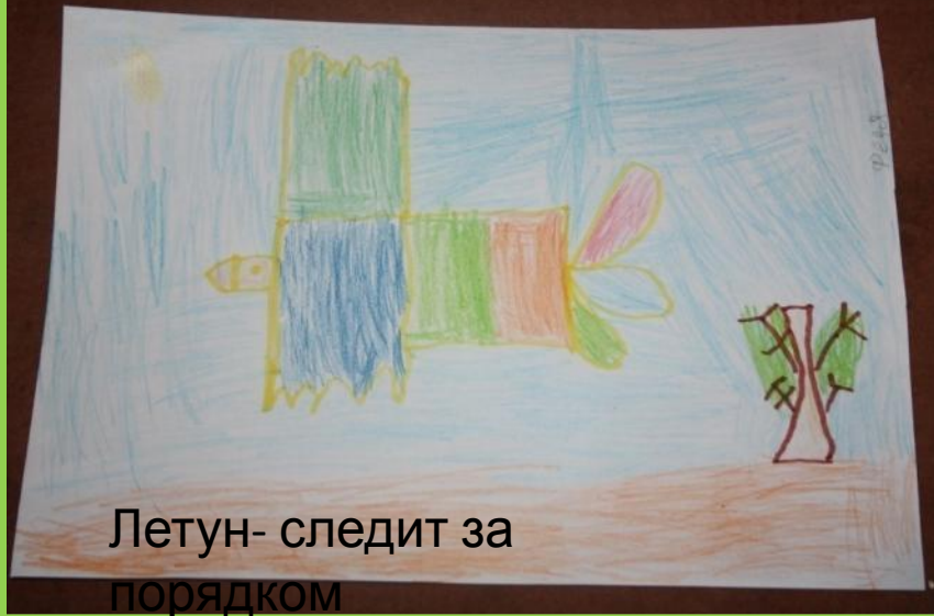
Летун- следит за порядком