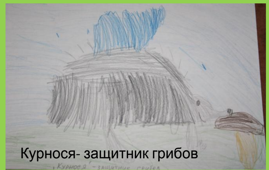
Курноса- защитник грибов