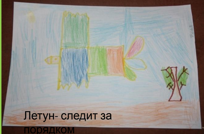
Летун- следит за порядком