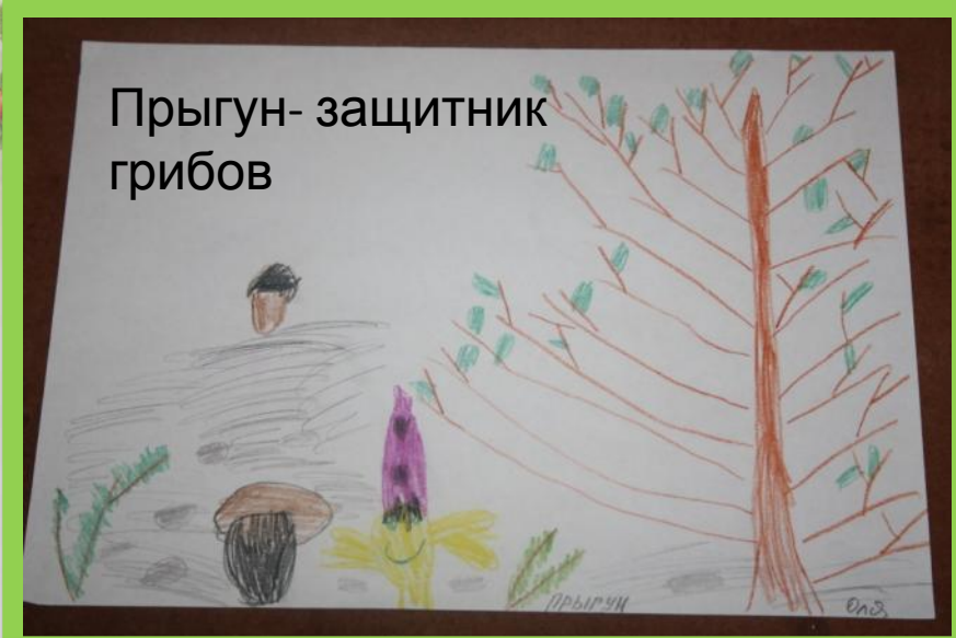
Прыгун- защитник грибов