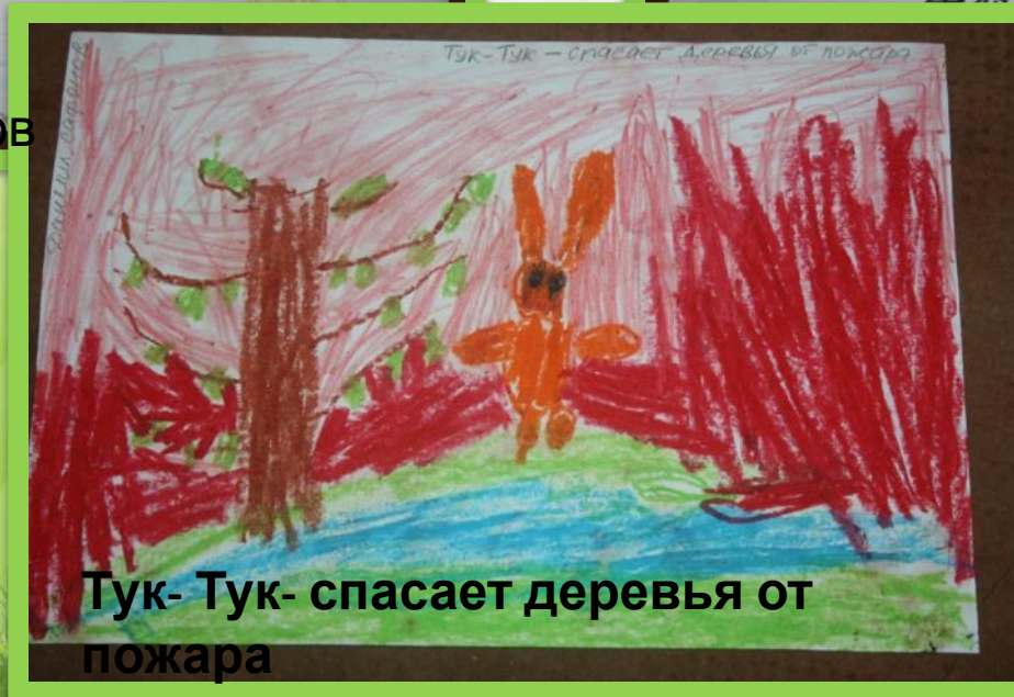
Тук- Тук- спасает деревья от пожара