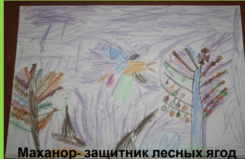
Маханор - защитник лесных ягод