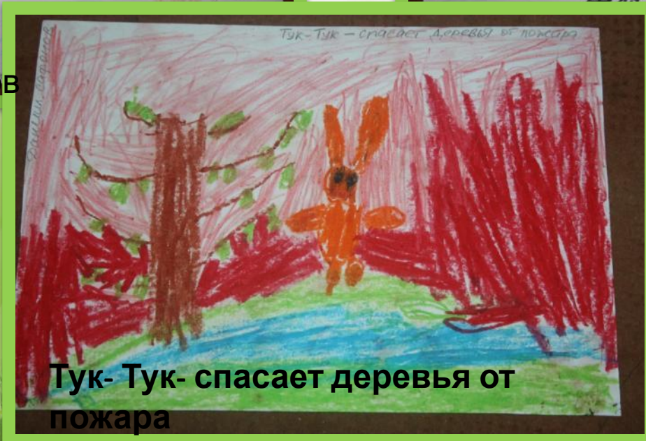
Тук- Тук- спасает деревья от пожара