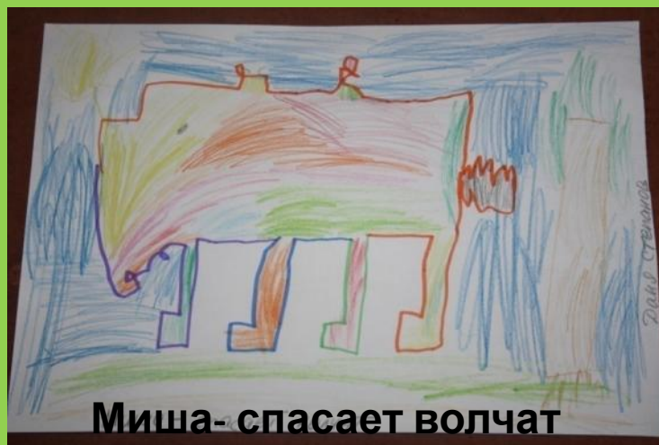
Миша - спасает волчат