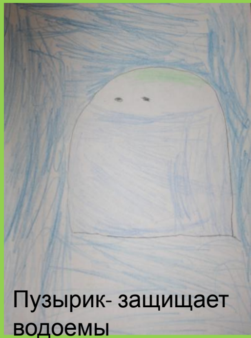
Пузырик- защищает водоемы