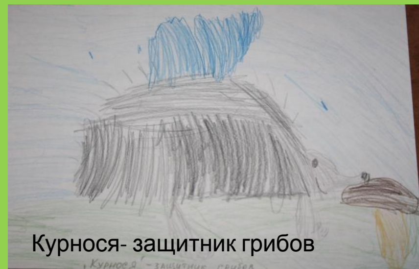
Курнося- защитник грибов