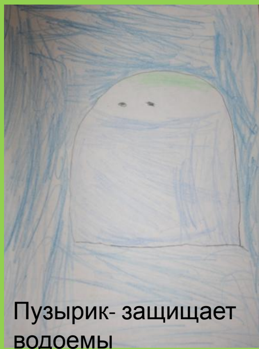
Пузырик- защищает водоемы