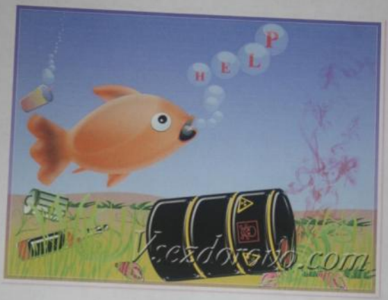
Рыбка и ее друзья

Сказка "Как два друга озеро спасли" Начли - были два друга на берегу озера Тонкие, длинные и дружные, они шли по лесу. Длинный был добрый, выносливый, а дружок маленький и любил кулечки в мешке. Они всегда отступали берег озера от мусора. И вот однажды им они уехали на работу, а бабушка оставила им в 10 утра на озеро навести много мусора, которые бросили пакеты, палки, пакеты в озеро уехали с работы, бросили бутылки в воду. И озеро стало грязным, рыбаки стало много и они кричали на маму своих друзей, но их никто не слышал. Тогда начали походить Вспомните Длинный с Дружком с озером и увидели что озеро стало грязным, вода темная, много мусора и люди кричали в нем кулечки, рыбными работами спасли озеро. Длинный свой мешок коренья бросил мусор в воду и зловоние в озере. Длинный как разодеть Длинный и Дружок а ребята они мальчишки назовут Длинный Красавчик а в