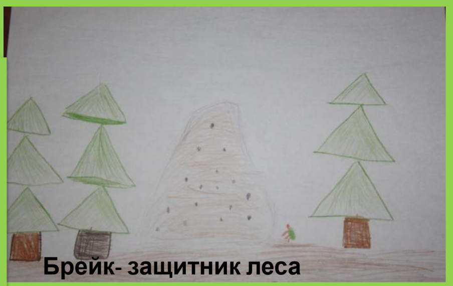
Брейк- защитник леса