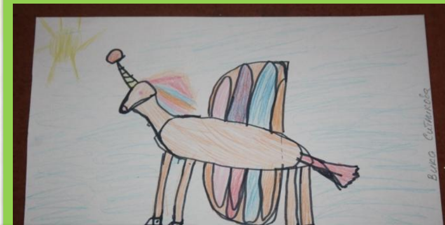
Пэг- защищает радугу