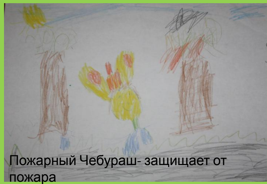
Пожарный Чебураш- защищает от пожара