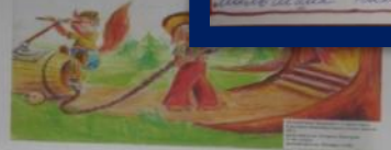
Экологическая сказка. Пожар в лесу.

В одной деревне жили дед да баба. И была у них внучка Маша. Очень Маша с подружками на улице гуляла. Недалеко от той деревни находился большой лес. А в том лесу жил, как известно, медведь. Жил он очень хорошо, всего ему хватало - и рыбы в реке было много, и ягод с кореньями хватало. А еще этот лес любили люди. В лесу люди тоже собирали и грибы, и ягоды с орехами, и даже дрова рубили. Всех лес кормил и выручал. А Маша с подружками любила ходить в этот лес на полянку. Там они веселились, играли, редили цветы и травы реали, деревья молодые ломали, а после себя мусор оставляли. Обертки, бумажки, пакеты из-под соков. Ничего после себя не убирали, думали ничего страшного не случится. И стало в том лесу грязно. Везде лежал мусор. Грибы и ягоды больше не растут. Когда медведь увидел всю эту грязь, очень расстроился. И решил, что надо что-то делать. Медведь начал весь мусор собирать. А ночью пошел с этим мусором в деревню, где Маша живет. Раскидал весь мусор по деревне. И оставил записку, чтоб люди больше в лес не ходили, а то он их задержит. На утро люди прочитали эту записку. Увидели весь мусор, разбросанный везде. Им стало очень стыдно. Они поняли, что натворили. Собрали весь мусор, и пошли просить прощения у медведя. Обещали больше лесу не вредить, с природой дружить. В лесу мусор не бросать, а с собой забирать.