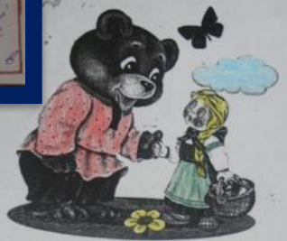
Экологическая сказка Маша и медведь

В одной очень чистой речке жила- была рыбка. У рыбки было много друзей: другие рыбки, улитки, раки и жучки. Однажды построили у реки завод. В воду стали сбрасывать отходы, вода стала мутная и грязная. Все подводные жители думали, что делать. И рыбка сказала: « Мы должны уплыть в другое место, чтобы люди поняли, что нельзя загрязнять реки». И все согласились. Все жители речки решили уплыть в другую реку. Все друзья рыбки очень скучали по своему родному дому. А когда люди заметили, что рыбки исчезли, они решили очистить воду. Они поставили на заводах очистные сооружения. Когда рыбка узнала об этом, она с товарищами вернулась в свою родную реку.