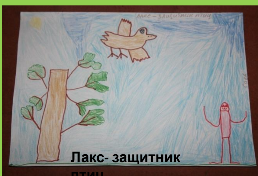
Лакс- защитник птиц