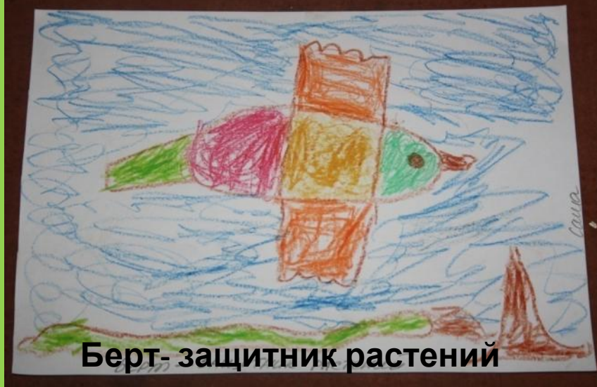
Берт - защитник растений