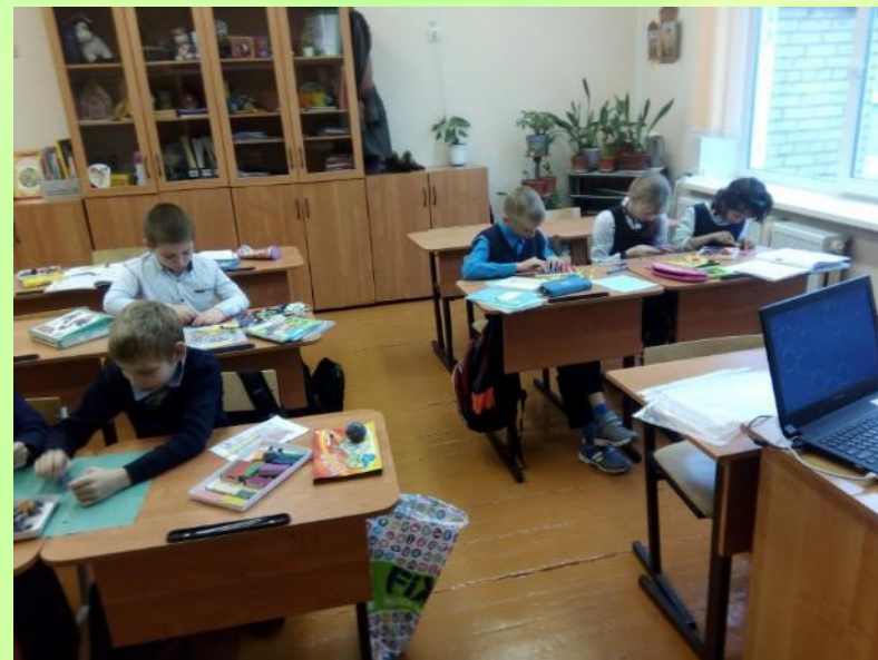
Работа с бумагой разных видов, работа в парах.