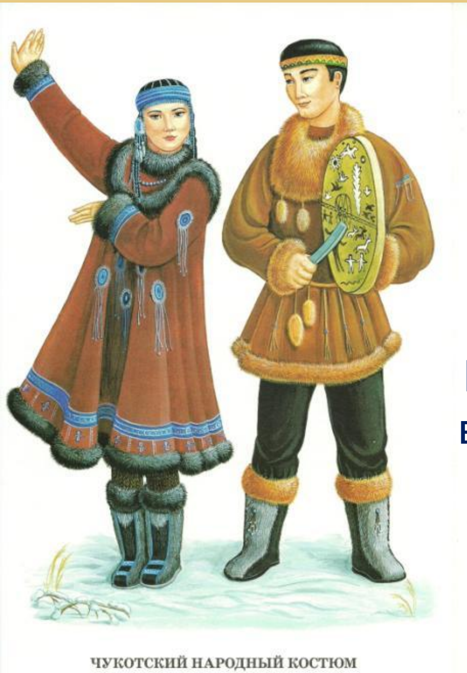
ЧУКОТСКИЙ НАРОДНЫЙ КОСТЮМ